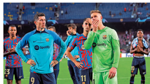
▲巴塞羅尼亞隊在歐聯賽場上。

烏拉圭、2002年日、韓世盃的土耳其與韓國、1994年美國世盃的瑞典與保加利亞，以及1986年墨西哥世盃的比利時；今屆在亞洲的卡塔爾、而且轉到冬季上演，隨時又有半冷門突圍。除比利時外，預料在歐洲盃有好表現的丹麥、分組對手不強的威爾士，都有機會成為今屆的「黑馬」。 大公報記者 譚德龍