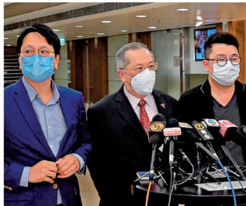
▲三名身兼中大校董會成員的立法會議員，要校方交代今次改校徽風波的細節。