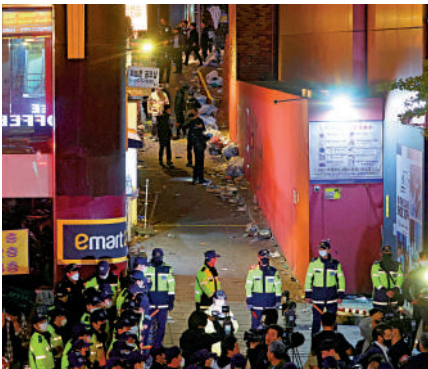
▲梨泰院出事的窄巷非常擁擠，陡峭的斜坡更加重損傷。

【大公報訊】據《衛報》報道：位於韓國首都首爾的梨泰院常有外國人聚集，發生踩踏事故的窄巷附近建有不少充滿外國風情的酒吧和夜店，每逢萬聖節、聖誕節、跨年夜等節日，都會變得非常熱鬧，該處多窄巷、斜坡，從地鐵站湧出的人潮與欲從店家離去的人群在路上交會，與香港的蘭桂坊十分相似。