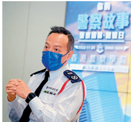
▲周一鳴表示，現時警隊約有5000個職位空缺。

警察招募體驗日將於11月20日在警察學院舉行，有興趣的市民屆時可即場投考！警務處處長（管理）周一鳴日前在記者會上表示，現時警隊約有5000個職位空缺，參考過往兩次招募體驗日的參加人數均有上升趨勢，相信活動對吸引更多市民投考警隊有一定作用。