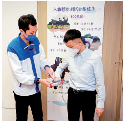
▲警察招募中心提供多項服務，包括即場面試、視力及手握力測試及VR虛擬實境射擊體驗等。