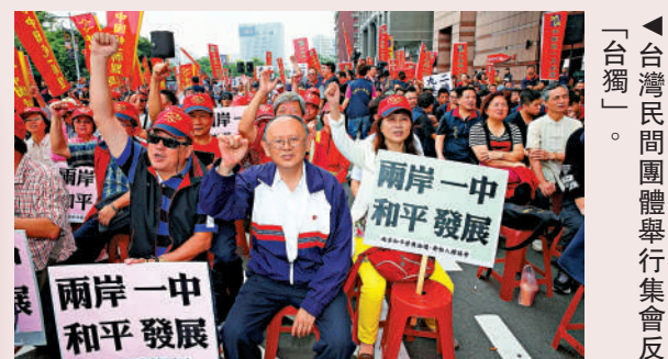
▲「台灣民間團體舉行集會反「台獨」。

文章指出，全面建設社會主義現代化國家，對依法治國、依憲治國提出了新的更高要求，我們要堅定不移走中國特色社會主義法治道路，以習近平法治思想為引領，堅持憲法自信，增強憲法自覺，把憲法作為全面依法治國的總依據，總結我國憲法實踐經驗，形成具有中國特色和時代特點的憲法性慣例、憲制性做法，更好發揮憲法在治國理政中的重要作用。