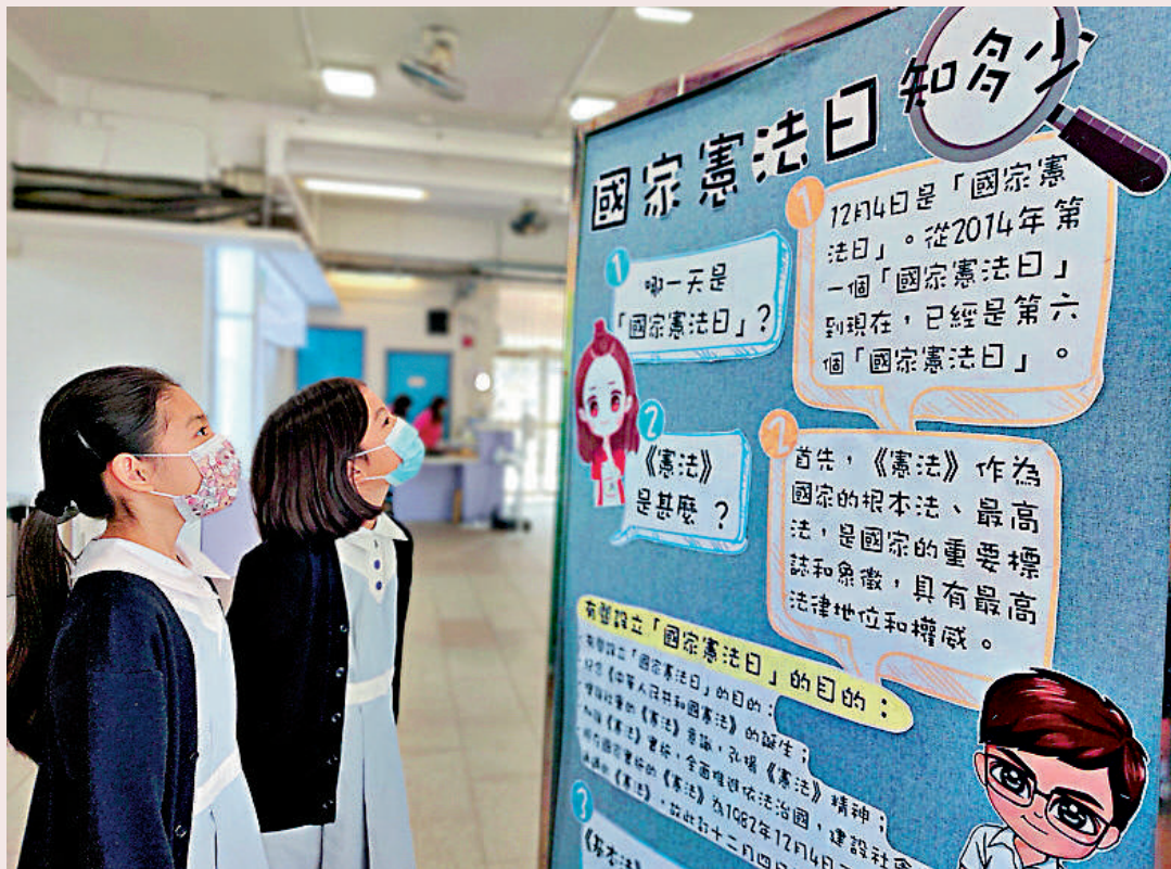
▲2020年，香港舉行國家憲法日相關活動，圖為學生觀看有關展板。

中共二十大報告明確提出：「堅持依法治港治澳，維護憲法和基本法確定的特別行政區憲制秩序。」全國人大常委會法制工作委員會主任沈春耀在近日出版發行的《黨的二十大報告輔導讀本》中撰文指出，全面準確、堅定不移貫徹「一國兩制」方針，必須鞏固憲法和基本法共同構成的特別行政區憲制基礎。沈春耀強調，要創制性運用憲法制度應對重大風險挑戰。他具體指出，2020年和2021年，全國人大常委會制定香港特別行政區維護國家安全法等措施，是推動香港局勢實現由亂到治的重大轉折。