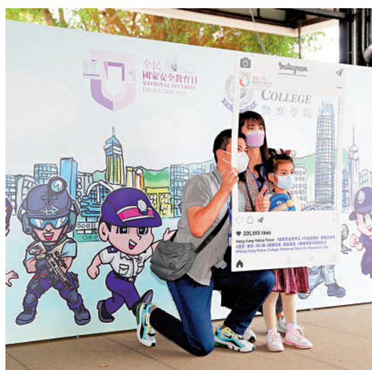
▲2021年4月15日，香港市民在全民國家安全教育日活動上合影留念。