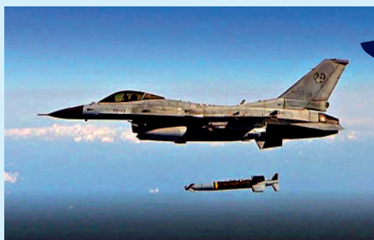
▲韓國空軍出動F-15K戰機，發射空對地導彈回應朝鮮。

中國社會科學院亞太與全球戰略研究院研究員、中國周邊戰略研究室主任王俊生分析指，「北方界線」實際上是一個溫度計，它是朝韓均不承認的敏感地帶，一旦觸碰，就說明雙方下定決心要採取強硬姿態。事件標誌着當前半島局勢