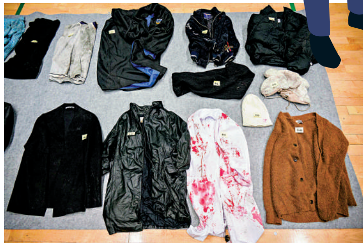
◀擺放在體育館內的1.5噸梨泰院失物，衣物有不同程度污損。

原定於10月30日舉行，預計吸引約4萬人到場的釜山亞洲音樂節取消；為期兩周的韓國版「黑色星期五」購物節開幕活動取消；原定於11月5日舉行的釜山大型煙花匯演無限期推遲；三大零售商新世界、樂天購物和現代百貨取消萬聖節促銷活動……韓媒指，梨泰院事故可能重蹈「世越」號沉船事故覆轍，導致消費者信心大幅下滑，減少旅遊及休閒活動支出。多名經濟專家稱，由於出口放緩、消費疲軟及韓國貶值，韓國GDP將在今年年底失去增長動力。