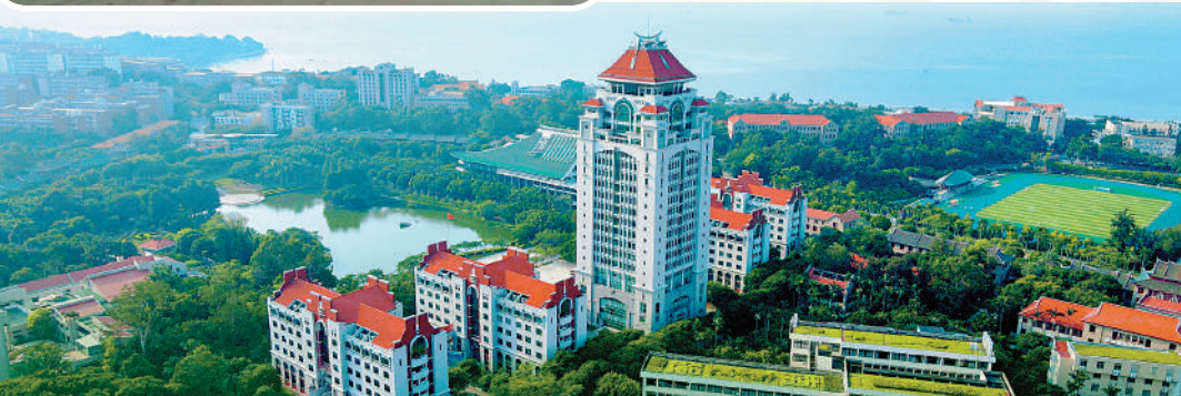
▲廈門大學在2022軟科中國大學酒店管理專業排名第六。