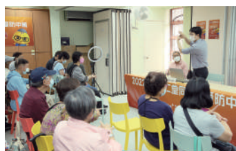
▲講座中，參加者齊齊跟北京同仁堂中醫師學習養生保健穴位按摩。