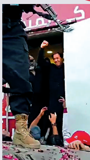
▲伊姆蘭·汗3日遭槍擊後腿部受傷。