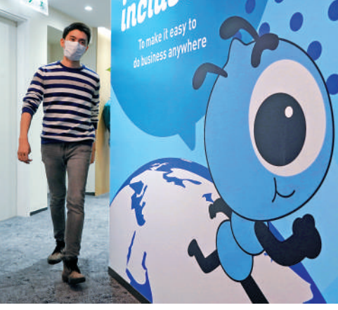
▲螞蟻銀行香港將與AlipayHK合作推出「先買後付」分期服務。