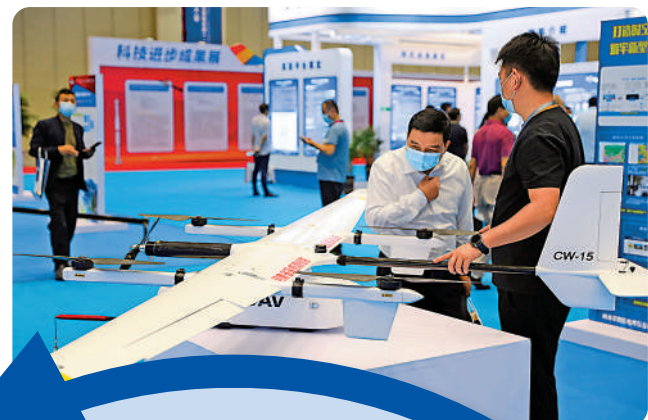
市民了解應用北斗系統的遙感測繪無人機。

白皮書指出，北斗系統星間星地一體組網，是中國首個實現全球組網運行的航天系統，顯著提升了中國航天科研生產能力，有力推動中國航天技術跨越式發展。中國從自身實際出發，因應世界衛星導航發展趨勢，從星座構型等方面創新系統設計，攻克混合星座等多項核心關鍵技術，在全球範圍實現一流能力。北斗系統可滿足用戶多樣化需求：向全球用戶提供定位導航授時、國際搜救、全球短報文通信等三種全球服務；向亞太地區提供區域短報文通信、星基增強、精密單點定位、地基增強等四種區域服務。