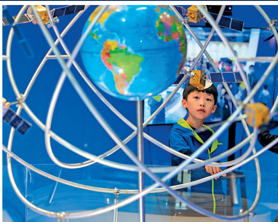
貴州小朋友參觀「北斗三號全球衛星導航系統」模型。

國務院新聞辦公室4日發布的《新時代的中國北斗》白皮書指出，中國將構建國家綜合定位導航授時體系，推動服務向水下、室內、深空延伸，提供基準統一、覆蓋無縫、彈性智能、安全可靠、便捷高效的綜合時空信息服務。中國衛星導航系統管理辦公室主任、北斗衛星導航系統新聞發言人冉承其表示，全世界衛星導航系統都是99%的指標，1%精度超標的時間大概是一年中的24個小時，我們通過各方技術和管理措施保障，把99%提高到了99.9%，雖然只是0.9%的提升，看似一小步，實則一大步。到2035年，希望無論是在水下、地面、室內、空中、深空甚至遙遠的太空，都有北斗，都有中國的時空體系。 大公報記者 劉凝哲北京報道