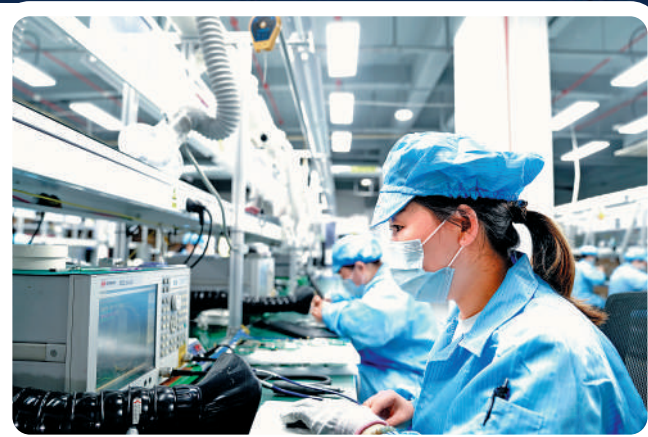
在中國北斗產業技術創新西虹橋基地，工人在忙碌。