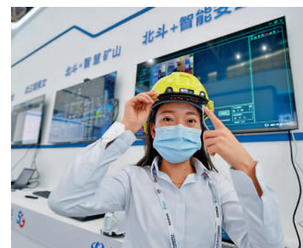
▲中國電信員工在中阿博覽會介紹「北斗+智能安全帽」。

特阿拉伯，已經應用於測量測繪地理信息的採集、城市市政基礎設施建設、沙漠人員或者車輛定位重要領域，當地用戶都認為北斗非常好用。非洲布基納法索政府將北斗高精度用到醫院的建設精確測繪過程中，特別是在新冠肺炎疫情當前，縮短一半以上的建造時間，6天就完成了施工測量，為疫情防控作出巨大貢獻。