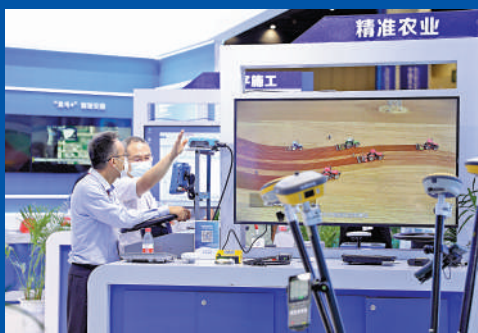
▲應用北斗的精準農業系統展示。