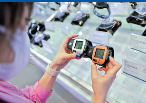
▲消費者對比北斗兩代短報文腕錶。 中新社