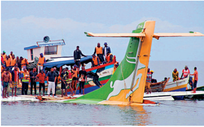
◀坦桑尼亞一架客機6日墜湖，造成至少19人遇難。

姆飛往卡蓋拉省的布科巴機場，降落前受惡劣天氣影響墜入機場附近的維多利亞湖。出事飛機為隸屬於精密航空（Precision Air）的PW494次航班，客機型號為ATR42-500，出事地點距離機場僅100米。精密航空成立於1993年，是坦桑尼亞最大的私營航空公司，總部位於達累斯薩拉姆，部分歸肯尼亞航空公司所有。 一名目擊者告訴坦桑尼亞廣播公司，當天機場附近能見度較差，飛機接近機場時在空中搖搖晃晃地飛行，未能及時轉彎掉進湖中。社交媒體上流傳的視頻和圖片顯示，出事的飛機幾乎完全淹沒在湖水中，湖面上只露出綠色和黃色的尾翼。救援人員試圖利用繩索拉出飛機，當地漁民也參與到救援當中。