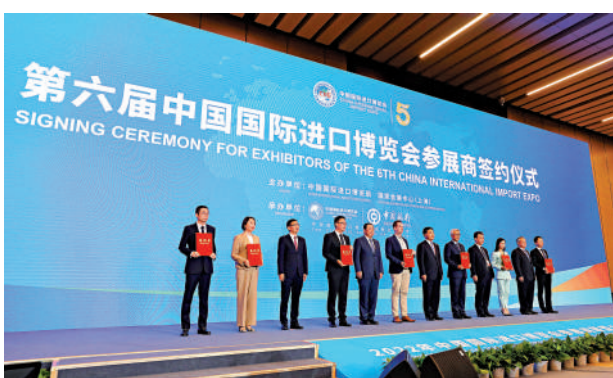
▲11月6日，2022年中國國際進口博覽會參展商聯盟大會在上海舉行。這是在大會期間進行的第六屆進博會參展商簽約儀式。

【大公報訊】據澎湃新聞報道：6日，2022年中國國際進口博覽會參展商聯盟大會暨第六屆進博會集體簽約儀式舉行。當日集體簽約第六屆進博會的企業和組展機構約有60家。其中包括：嘉吉、恆天然、梅賽德斯奔馳、寶馬、捷豹、沃爾沃、杜邦、西門子、花王、雅詩蘭黛、H&M、羅氏、阿斯利康、默沙東、波士頓科學、飛利浦、滙豐、渣打銀行等。