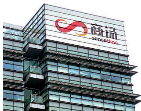
▲商湯股價昨炒高35%，以全日最高1.8元收市，見逾一個月高位。

根據商業訊息查詢平台天眼查顯示，快手於上月底進行戰略融資，投資方是北京廣播電視台，注資約101萬元人民幣，持股1%。