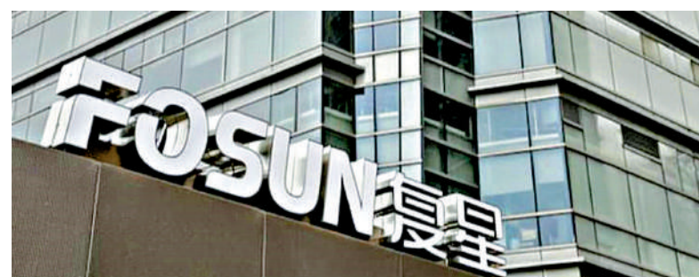
復星出售招金礦業的市股折讓1.75%。

【大公報訊】近期不停出售資產套現的復星國際(00656)，繼續馬不停蹄減持股份。復星國際公布，非全資附屬A股公司「豫園股份」剛於周日簽訂轉讓協議，以每股6.72元把持有的6.54億股招金礦業(01818)H股售予紫金礦業(02899)，今次出售股份佔招金礦業已發行H股約25.06%或已發行股份約20%，套現43.95億元。是次出售股份價格較招金礦業上周五收市價折讓1.75%。復星國際昨日股價升7%，收報5.32元；招金礦業升9.6%，收報7.5元；紫金礦業升10.2%，收報8.92元。