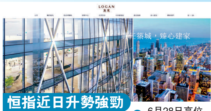
恒指近日升勢強勁 6月28日高位 22418點