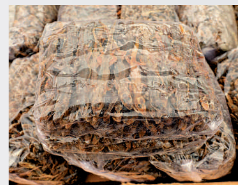
走私貨物中包括有俗稱「蛤蚧」的乾壁虎。

內河船等低成本的做法經常被截獲, 遂轉用成本及運費較高, 需時亦較長的遠洋船企圖逃避法眼。