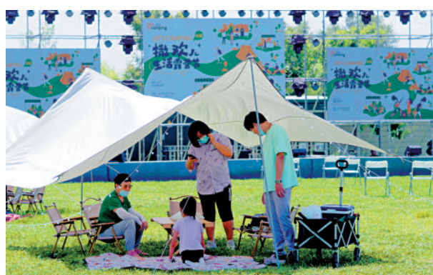
市民來到北京世園公園露營度周末。

此外，《規劃》還提到，要優化露營產品供給。鼓勵開放郊野公園提供露營服務，在城市郊野、農村地區等建設更多露營基地。推動露營基地完善配套服務設施，開展多種戶外運動項目，鼓勵在營地周邊配套登山、徒步、騎行、垂釣、冰雪、賽車、馬術、航空、水上等戶外運動設施及服務，提高露營消費黏性。加快建設露營旅遊相關基礎設施，鼓勵戶外運動裝備企業立足群眾露營需求，規範露營市場，推動露營產業健康可持續發展。