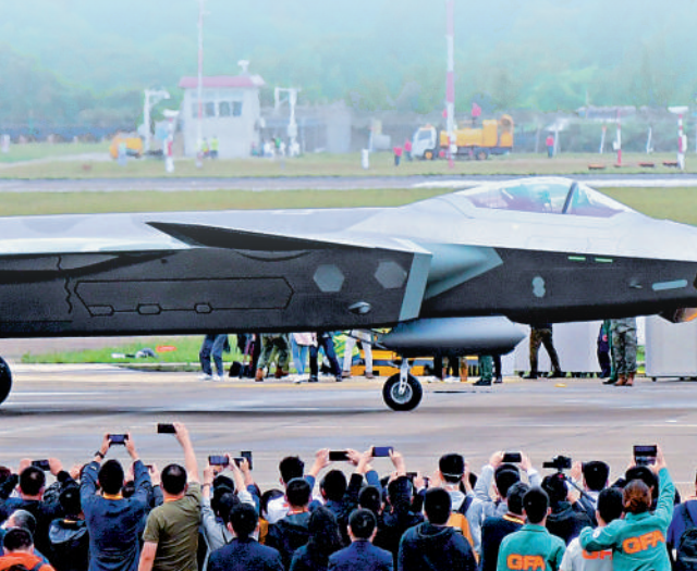
▲8日，觀眾在航展上觀看剛飛行歸來的殲-20。

「超級奶媽」運油-20在飛行表演時非常靈活，低空飛行，在飛行中釋放3根加油管，在轉彎過程中也具備輸油能力。值得一提的是，運油-20在飛行時與淡水斗給水箱補水，兩種補水模式大大提升了其滅火能力。