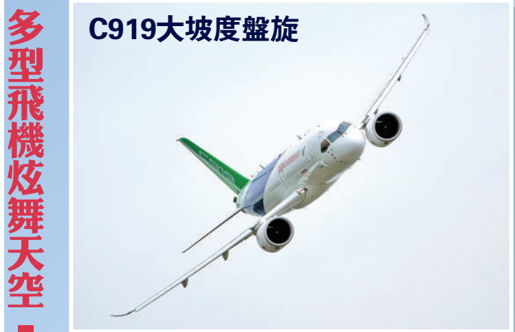
解說：於民航局頒發型號合格證後首現航展，進行大坡度盤旋，展現非常優秀的機動能力。