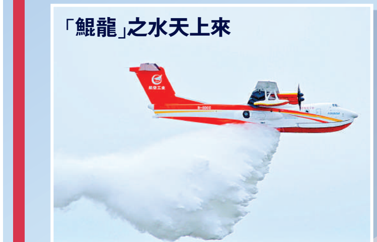
解說：以全新塗裝亮相的「鯤龍」AG600M（滅火型）進行了12噸投水演示，全面展示滅火任務系統功能。