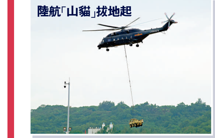
解說：12時，陸航直-10、直-8L、直-20三型直升機齊齊升空表演，其中直-8L更將「山貓」全地形車帶到了空中。