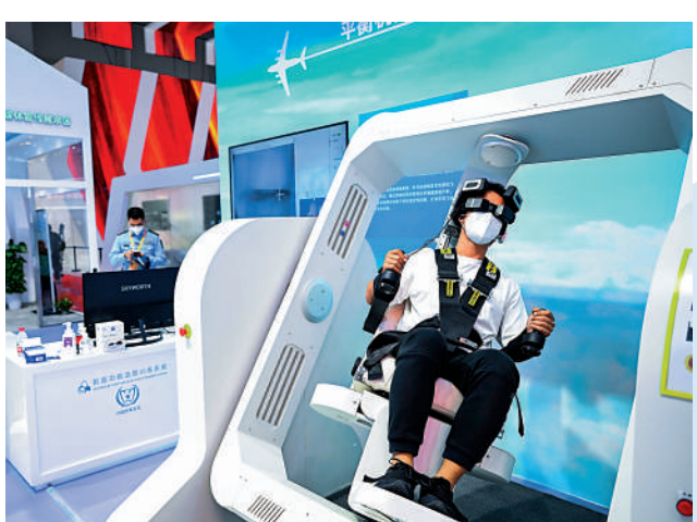
▲珠海航展上展出了平衡機能選拔評估系統。新華社

正如軍情人士坦言：「客戶能想到的，我們很多企業基本上都能提供。國產裝備可實現性價比更優，在技術過硬的同時，性價比優勢讓客戶無法割捨。」這成熟可靠的性價比優勢背後，是中國龐大且齊全的製造業體系，涵蓋了不同領域的科研人員、工程師、設計師、技術工人和成產生產線，以此為基礎的製造業形成幾乎「無所不包」的強大能力。