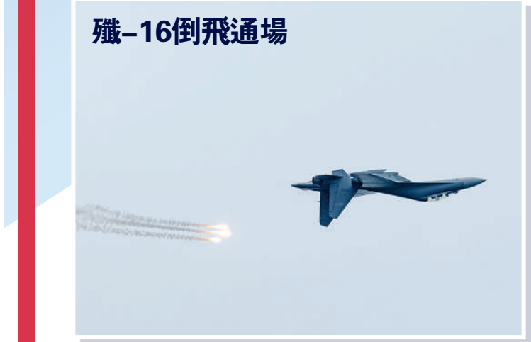
解說：座艙朝下，機腹朝上，這個動作容錯率極低，特別考驗裝備能力和飛行員的操作水平。網絡圖片