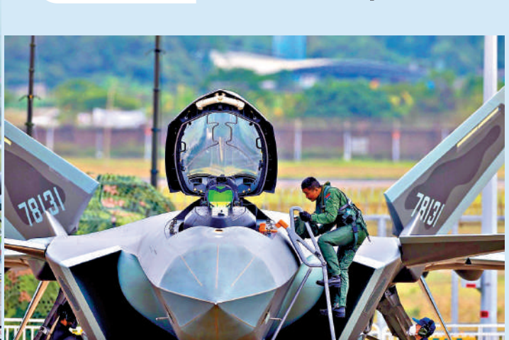
▲殲-20飛行員歷來首次在航展現場進出駕駛艙。

殲-20戰鬥機 機長：21.2米 翼展：13.01米 最大航速：2.0馬赫 彈藥容量：2枚PL-10近距格鬥彈 4枚PL-15中遠程空空彈 據珠海航展及公開資料整理