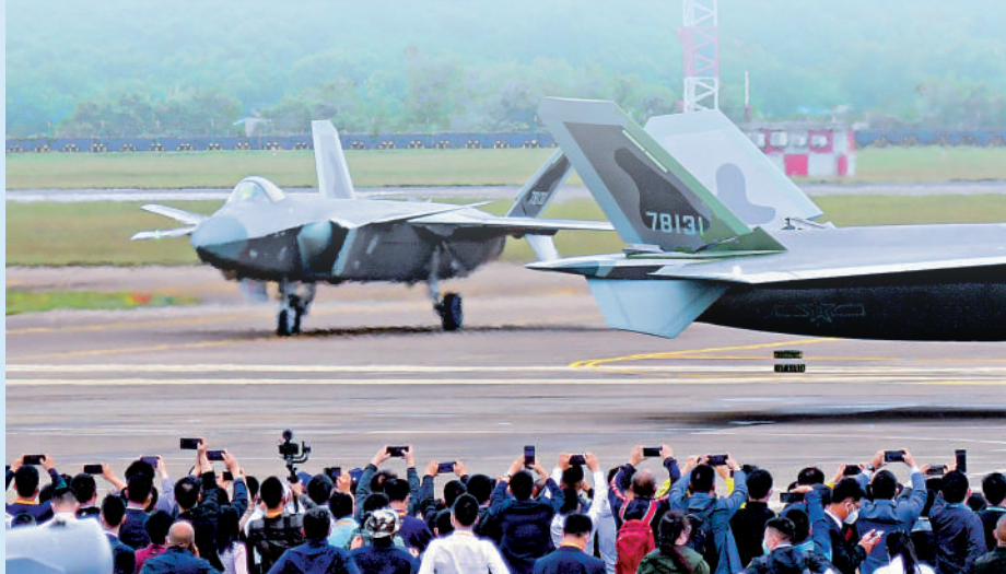
▲8日，觀眾在航展上觀看剛飛行歸來的殲-20。

飛鴻跨域無人作戰系統在珠海航展進行首次演示。據悉，該演示以城市外圍圍攻和城內殘餘清剿為任務想定，參演裝備包括「長空奇兵」中程無人作戰系統和「空地勇士」空地協同原型系統。