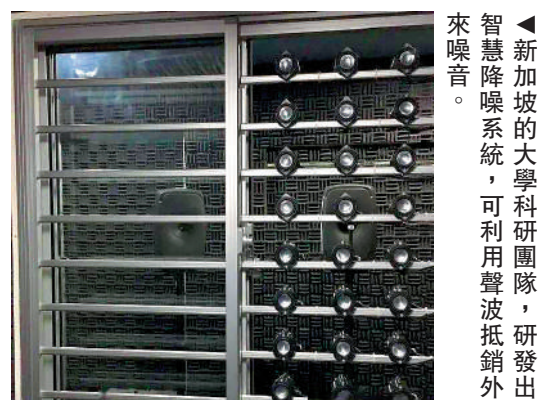
▲新加坡的大學科研團隊，研發出智慧降噪系統，可利用聲波抵銷外來噪音。

至於內地方面，參考城中村（城市裏的村莊）的做法，它們在城市化發展的進程中，逐漸演變成居民區，其中一個特點是初期的管理較差，噪音亦難以受控。例如裝修所產生的噪音，他們的解決辦法是與裝修的屋主協商，若協商不成則會向物業管理投訴，並讓物業管理出面處理。一般情況下，物業管理方可要求裝修單位做好裝修隔音設施等。如多次反映噪音情況而沒有明顯改善，特別是影響到正常休息時間，則可向派出所報警或向當地的環保部門作出投訴。 大公報記者