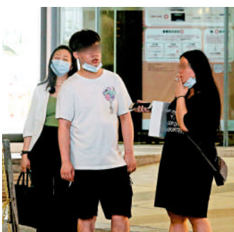
▲政府長遠控煙政策包括提高合法購買吸煙產品年齡。

【大公報訊】醫務衛生局局長盧寵茂表示，香港的吸煙率一直持續下降，由40年前的23%下降至去年的9.5%。儘管香港吸煙率之低已位於世界前列，但政府控煙政策的長遠目標，是將來徹底消除煙草禍害，包括提高最低合法購買吸煙產品年齡，使下一代不能合法地購買吸煙產品。盧寵茂昨日出席「香港控煙四十年周年座談會」致辭表示，政府致力在2025年將吸煙率降至7.8%或更低，有必要採取更積極進取的措施，令非吸煙者不會染上煙