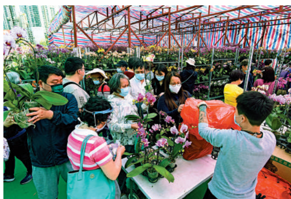
▲維園年宵市場的攤位將於今、明兩日競投，競投底價繼續凍結於去年水平。圖為以往維園年宵情形。中新社

政府合署二樓禮堂，維園年宵的120個攤位於今日分上、下午兩個時段競投，上午時段由9時至中午12時30分，下午時段由下午2時開始；明日推出餘下55個攤位，由上午9時至競投結束為止。深水埗花墟年宵的攤位公開競投，則於下周一進行。