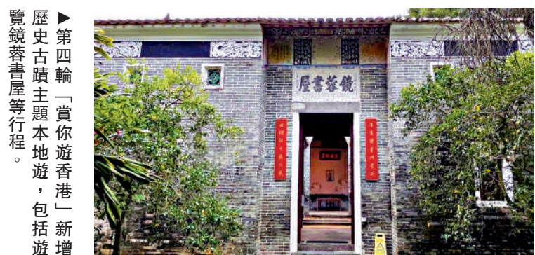
▶第四輪「賞你遊香港」新增歷史古蹟主題本地遊，包括遊覽鏡蓉書屋等行程。

本地遊成為疫下新潮流，旅遊局昨日公布第四輪「賞你遊香港」首批約一百八十個行程，近九成行程為免費，今日上午10時就是比拚手速的報名時機！今次新增歷史古蹟主題本地遊，包括遊覽伯大尼教堂、鏡蓉書屋等行程，亦有參觀沉浸式數碼藝術美術館與香港故宮文化博物館的貫穿古今之旅，了解濕地保育情況等；部分旅行社推出收費行程，支付最多二百元團費可參加升級「尊尚旅行團」，例如老少咸宜的主題樂園遊覽，以及享用五星級酒店的自助餐。