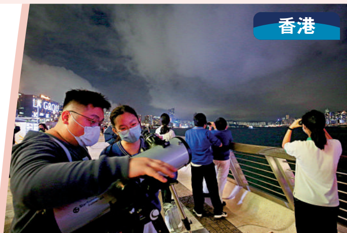
▲有中學生帶備望遠鏡到尖沙咀海濱觀賞月食。