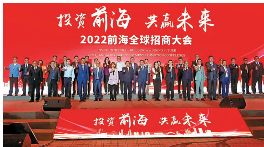
▲2022年前海全球招商大會發布「前海全球服務商計劃」。