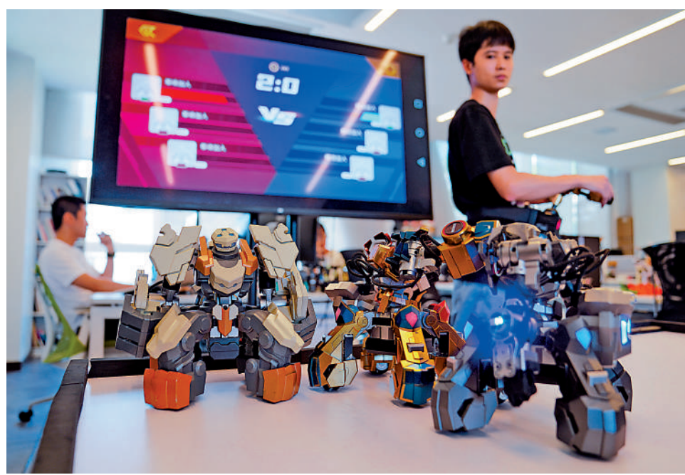
▲深圳前海夢工場內，某科技公司展示自己研發的機器。

●支持生物技術、新能源等研發類企業發展，實施15%企業所得稅優惠；對粵港澳合作的新型研發機構，給予每年最高1000萬元建設資金支持。