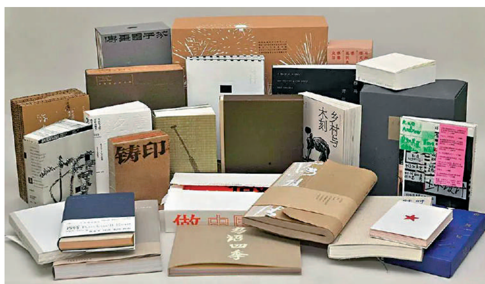
▲25種圖書獲得2022年度「最美的書」稱號，並將代表中國參加「世界最美的書」評選。

材質與文本內容相得益彰，很好地提升了這本非遺書籍的人文內涵和閱讀溫度。「最美的書」創立於2003年，迄今共有446件設計作品脫穎而出、榮獲稱號。