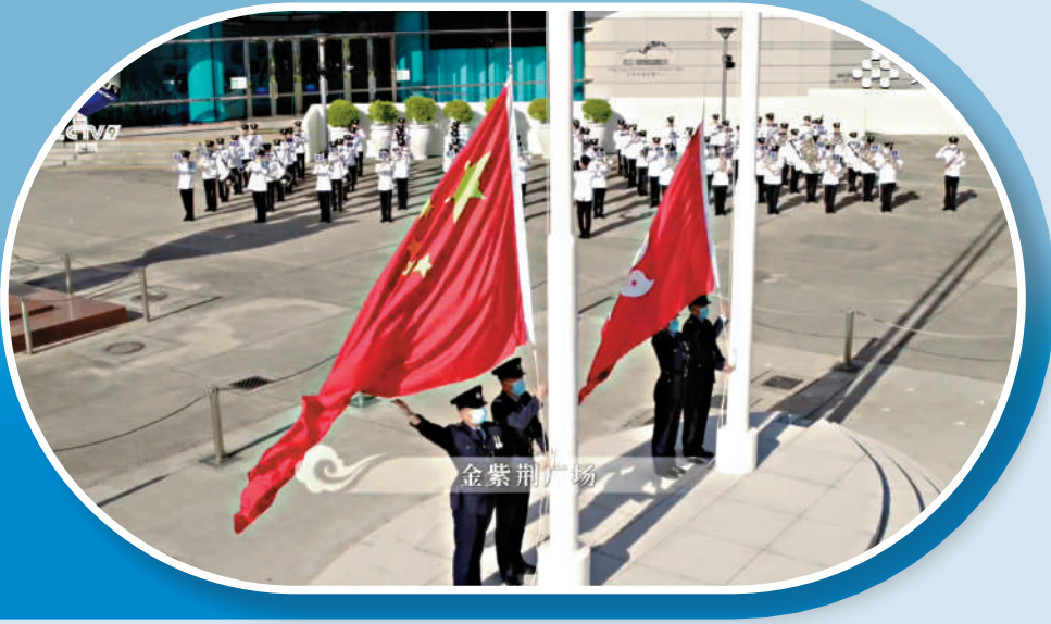
▲《航拍中國》記錄金紫荊廣場每天舉行的升旗儀式。