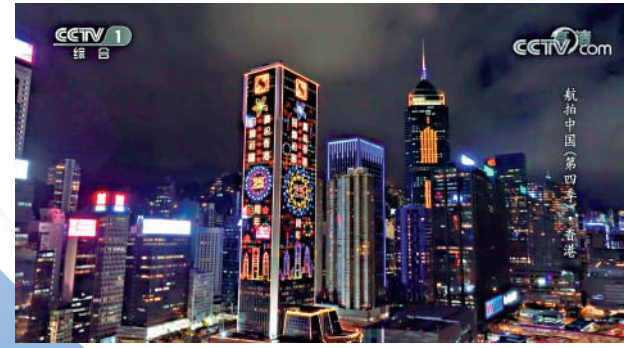
▲香港商廈亮燈慶祝回歸25周年。

《航拍中國》全系列共計動用73架直升機、320架無人機，總航程超90萬公里。作為《航拍中國》的收官之作，第四季進一步運用極致的視覺藝術與最前沿的技術，充分體現了「5G+4K/8K+AI」和「思想+藝術+技術」的創新融合。除了前三季用過的直升機、大型無人機以外，第四季嘗試了高分辨率遙感衛星拍攝、低照拍攝等。