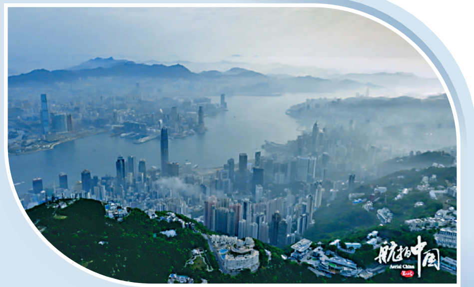
▲《航拍中國》第四季首次飛越香港拍攝，勾勒出有溫度的香港影像。