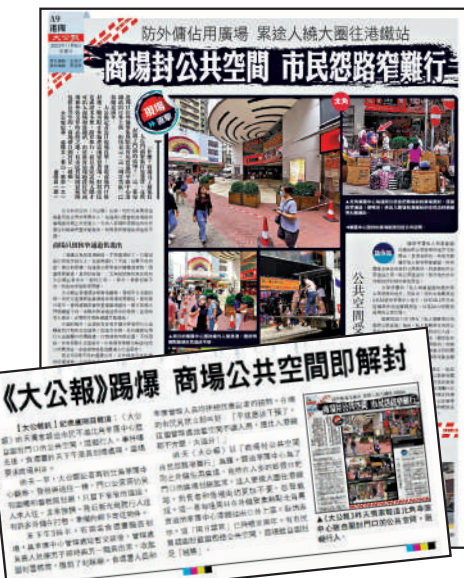
▲《大公報》日前獨家報道華匯中心每逢周日圍封公共空間，令出入市民怨聲載道，商場即撤回圍封。

就「華匯中心未有保持公共空間通暢，影響市民出行」相關事項，大公報記者早在上月27日發郵件向屋宇署查詢，其間多次追問進展，但至截稿日，屋宇署依然表示需時了解。