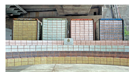
▲海關分別在青衣和屯門破獲兩宗走私香煙案件，檢獲4400萬支走私香煙。

海關指出，截至本月9日，連同今次行動中檢獲的懷疑私煙，海關今年檢獲共約5.54億支懷疑私煙，較去年全年檢獲約4.27億支私煙超出三成，強調會繼續根據風險評估和情報分析從源頭堵截，並透過針對貯存及分銷販賣多管齊下的執法策略，致力打擊私煙活動。