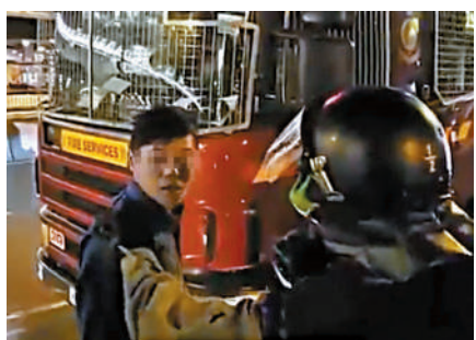
▲涉案消防隊目(左)2019年11月在暴亂現場與防暴警察口角及肢體衝突，引起傳媒關注。

事。短訊要求各消防局局長，查詢局內同事，有沒有借錢或投資在該名涉案者聲稱的公司。有人更在群組中形容案件是香港世紀大騙局，指騙案金額高達5000萬，好多同事「中招」，包括兩名「老總」(消防總隊目)分別被騙60萬和320萬。