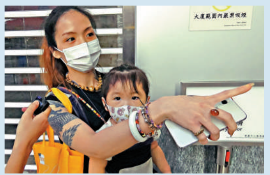
▲街坊李小姐不滿地說，每次推BB車路經時都十分狼狽，應該移走花槽。