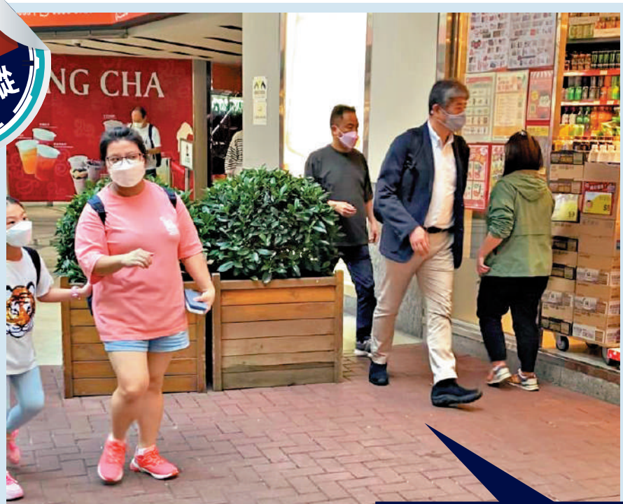
▲華匯中心在廣場和行人路之間，擺放逾1米高的花槽陣，令行人出入十分不便。