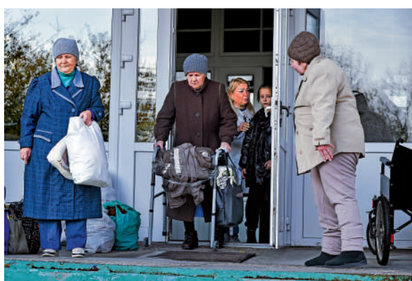
▲從赫爾松撤離的平民5日前往克里米亞。

【大公報訊】綜合《紐約時報》、今日俄羅斯、法新社報道：俄羅斯國防部長紹伊古9日宣布，為保護軍人的生命和部隊戰鬥力，俄軍將從烏克蘭南部重鎮赫爾松撤離，並在第聶伯河東岸重新建立防線。美媒稱，撤軍對克里姆林宮而言是一次重大挫折，或將成為俄烏衝突的轉折點。烏方對此持謹慎態度，懷疑俄軍是在「誘敵深入」。美軍參謀長聯席會議主席米利稱，俄烏各自的傷亡人數均超過10萬，現在是和談的時機。