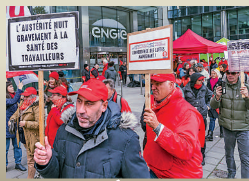
▲比利時民眾9日參加罷工，抗議通脹高企。

歐盟各成員國就統一設定能源價格上限爭執不下，法國、葡萄牙和西班牙等國已自行出台限價措施。比利時的工會敦促政府採取類似措施，不要再等待歐盟做決定。工會方面還要求加薪，以及對能源企業徵收暴利稅。