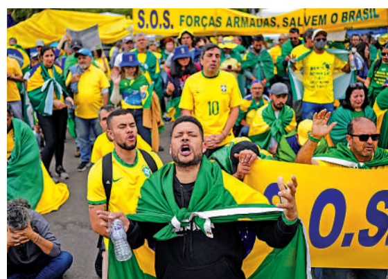
▲博索納羅支持者5日舉行示威，要求軍方調查大選結果。

路透社表示，這份報告可能成為博索納羅支持者繼續示威的藉口。候任總統盧拉強調，示威者沒有理由質疑選舉結果，應該被調查的是那些資助抗議活動的人。