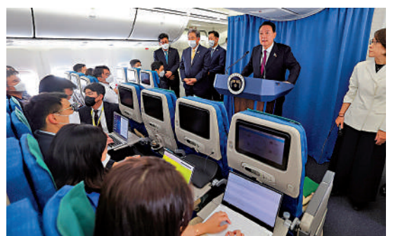
▲尹錫悅拒絕讓MBC記者登上總統專機，引起爭議。

今年9月，MBC播出了尹錫悅訪美期間疑似辱罵美國國會並提到美國總統拜登的片段。尹錫悅政府指責MBC進行歪曲報道，並解釋說尹錫悅罵的是韓國國會。