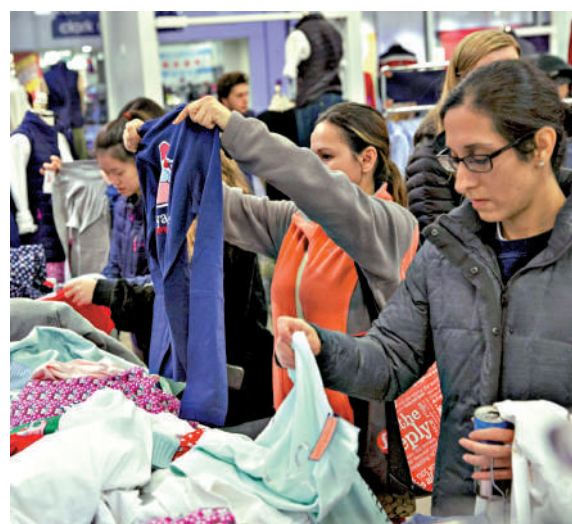
▲美國10月消費者物價指數按年升幅收窄至7.7%，分析師預期聯儲局12月停止重手加息。

聯儲局上周連續第4次加息，期望把通脹率遏低至2%的目標水平之內。當時該局表示，目標利率將會進一步上升，但加息速度未來也可能放緩。