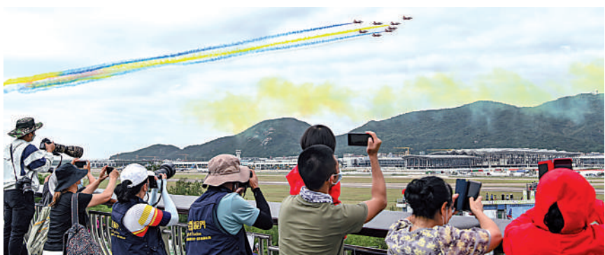
▲11月11日，觀眾在珠海航展上觀看中國空軍航空大學「紅鷹」飛行表演隊以8機大機群低空通場。

於11時11分「卡點」為人民空軍慶生，覺得非常震撼。「殲-20的引擎聲非常響亮，表演了多個高難度動作，孩子激動得大喊大叫。」王小姐說。