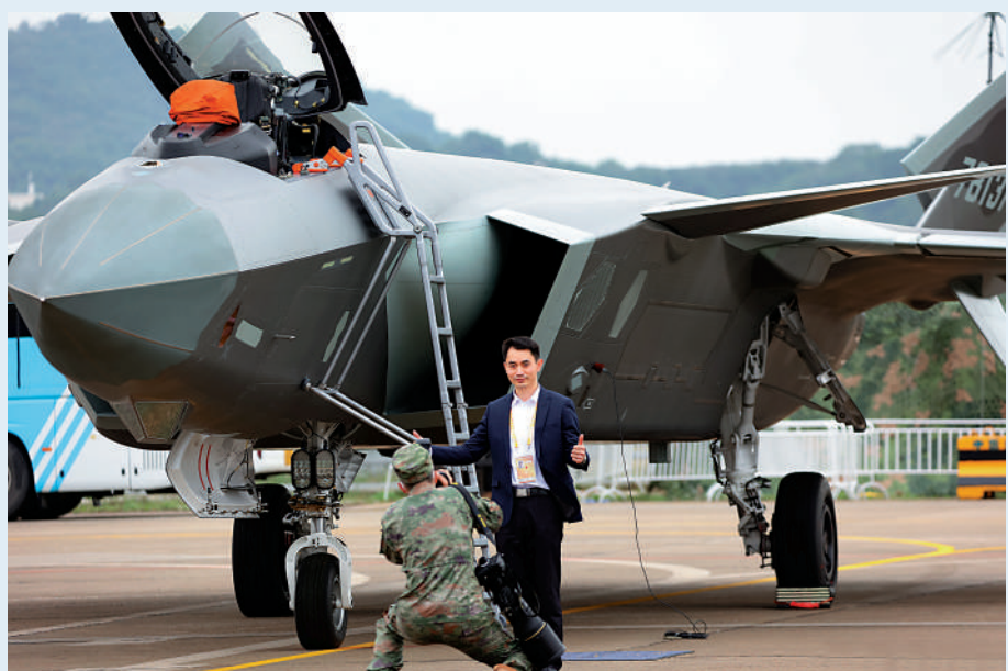
▲「神十三」航天员葉光富在殲-20前留影。