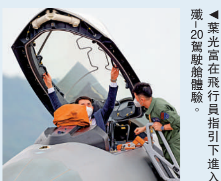
▲葉光富在飛行員指引下進入殲-20駕駛艙體驗。

11月8日，珠海航展開幕當天，有網友在航展現場看到航天员葉光富參觀殲-20「威龍」。葉光富除了與飛行員合影，還坐進了殲-20駕駛艙。據了解，葉光富曾是空軍一級飛行員，也飛過包括殲-7等戰鬥機。從網友照片可