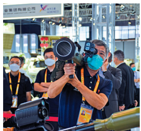
▲現場觀眾體驗陸軍合成旅裝備。

無人機營聚焦陸軍無人機和有人無人協同作戰應用。記者看到，現場在展示無人機裝備領域最新發展成果的同時，還展示了無人機與地面裝備相互配合、協同作戰的新質實戰能力。