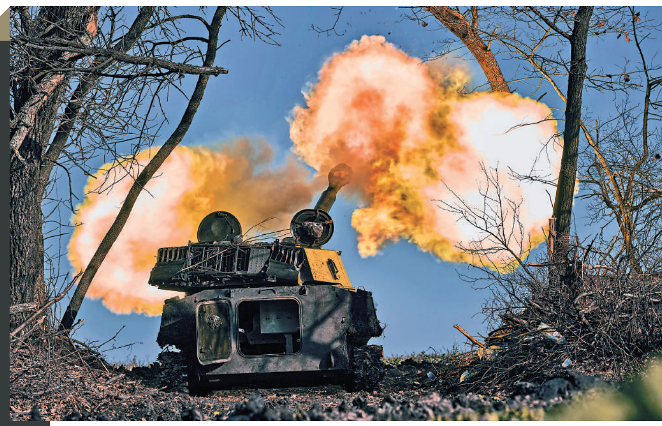
▲美國已向烏克蘭提供大量榴彈炮，對炮彈需求量極大。

9月，韓國與羅馬尼亞簽署意向書，宣布雙方成為軍貿合作夥伴。羅馬尼亞有意購買韓國的K2主戰坦克和K9自走炮。 韓國政府堅稱不會向烏克蘭提供殺傷性武器。但美媒11月10日披露，韓國將通過與美國的一項機密軍售協議，向美國出售10萬發最終用於援助烏軍的炮彈。