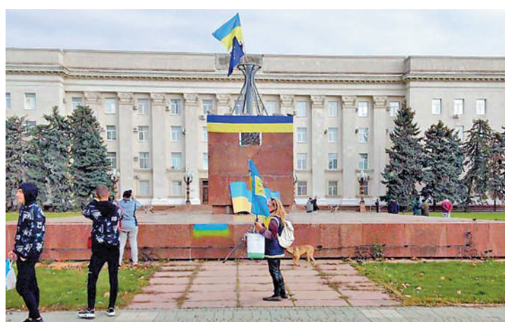
▲俄軍撤出赫爾松，部分市民在市中心迎接烏軍。網絡圖片