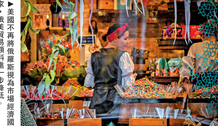
▲美國不再將俄羅斯視為市場經濟國家，俄美貿易額料進一步降低。法新社

【大公報訊】綜合BBC、法新社報道：俄羅斯9日宣布從烏克蘭南部重鎮、位於第聶伯河西岸的赫爾松撤軍，11日宣布已完成撤離工作，逾3萬名士兵和全部武器裝備已轉移到第聶伯河東岸。與此同時，烏軍進入赫爾松市區，社交媒體上流傳着市中心升起烏克蘭國旗的照片。俄羅斯國防部發言人科納申科夫11日表示，俄軍各部向第聶伯河東岸轉移完畢，已進駐到預設防線和陣地，沒有一件裝備或武器被拋棄在西岸。 據法新社報道，俄軍共轉移了超過3萬名士兵和5000件裝備。俄方表示，西岸部隊有被孤立的風險，撤軍是為了保障軍人的生命和部隊作戰能力。烏方對俄方撤軍消息持謹慎態度，懷疑俄方會在市內設伏。但11日有照片和視頻顯示，離開赫爾松的主要通道安東諾夫斯基本橋已經被炸毀。這說明俄軍的撤離工作的確已經結束。據CNN報道，烏軍11日已進入赫爾松市區，一些市民聚集在市中心的廣場上，揮舞着烏克蘭國旗以示歡迎。 赫爾松是重要黑海港口，亦是通向克里米亞的門戶，對俄烏雙方均有重要戰略意義。俄軍於3月初佔領赫爾松，這裏是俄方在第聶伯河西岸控制的唯一一座城市。多家西方媒體稱，俄軍撤離赫爾松，對俄方而言無疑是重大打擊。