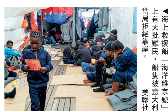
▲海上救援船「海洋維京號」上有大批難民，船隻被意大利拒岸。

意大利新總理、極右派領袖梅洛尼譴責法國反應「不可理解且不合理」，指出意大利今年已經接收9萬難民，實在難以負擔，歐盟其他國家不能把意大利當成歐洲唯一的非法移民收容港口。