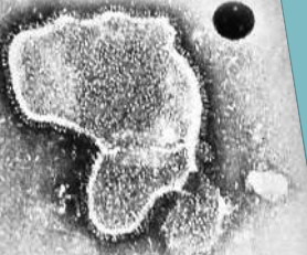
▼一名感染呼吸道合胞病毒(RSV)的美國兒童。