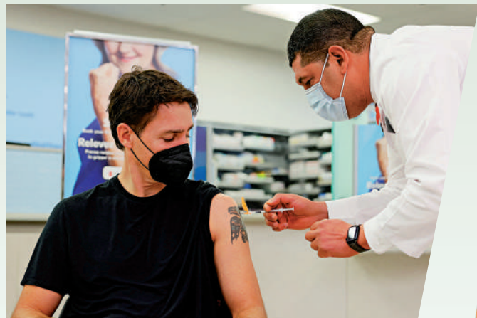
▲加拿大總理特魯多9日在一家藥房接種新冠疫苗加強劑。路透社

【大公報訊】綜合CNZ、路透社報導：北美地區今年冬大形勢嚴峻，面臨着流感、呼吸道合胞病毒(RSV)和新冠病毒的「三重疫情」威脅。大面積的感染令急診室內擠滿了患者，醫療系統難頂重壓，兒童病例人數激增。面對新一波病例的激增，加拿大安全省首席衛生官莫爾表示，有必要提議政府重頒口罩令，在冬季高峰來臨前進一步防止疫情傳播。