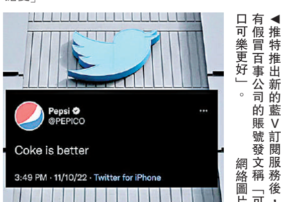
◀推特推出新的藍V訂閱服務後，有假冒百事公司的賬號發文稱「可樂更好」。