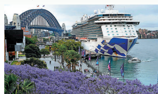
▲郵輪「盛世公主號」上有800名新冠確診者，該船在12日停靠澳洲悉尼港。

新南威爾士州於10月14日取消了对陽性患者強制自我隔離的規定。當局11日發出警告，該地區已進入第四波新冠高峰，截至10日下午，約有2萬例確診，較一周前暴增7000多例。