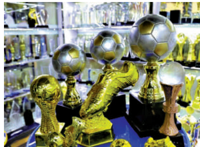
▲世界盃獎盃、徽章等紀念品生意火熱。