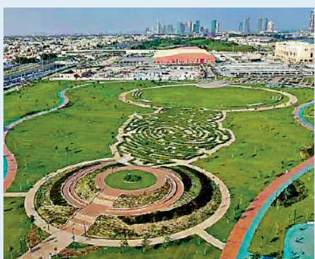
▲世界盃球場周邊的體育公園一片鬱鬱蔥蔥。

【大公報訊】據南方日報報道：卡塔爾的富庶人盡皆知，但養護樹木在這裏仍然是一筆不小的開支。由於卡塔爾是個淡水比汽油更貴的國家，室外綠化項目所需苗木一向從國外進口，主要從中國、泰國、印度等相近緯度的國家引進，而廣東供應的苗木佔到其中的40%以上。