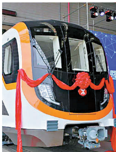
▲車頭造型棱角分明，整體趨於扁平化設計，整體性較強。