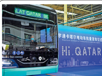
▲741台宇通新能源客車交付卡塔爾國家運輸公司。