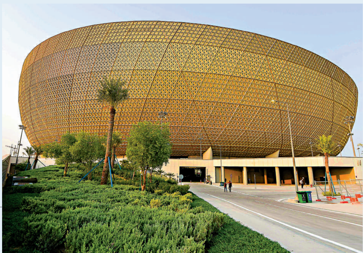
►盧賽爾體育場是卡塔爾世界盃主體育場，以碗形弧面展現建築之美。圖為盧賽爾體育場外觀。新華社

今年前三季度，深圳出口平板顯示模組312.5億元人民幣，出口體育設施及設備52.5億元，同比增長12.5%。國內外消費者的中國產品認知不斷被「深圳智造」刷新。