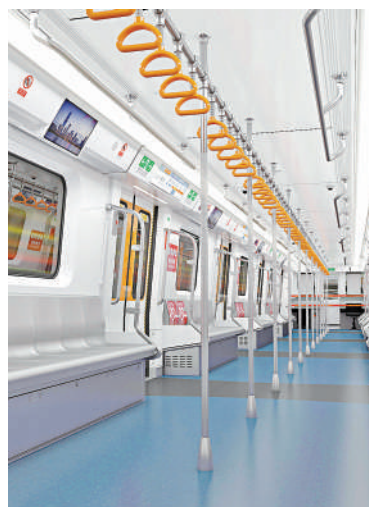
▲列車內部，司機室與客室採用貫通一體式設計，寬敞明亮。

術，速度100公里/小時，8輛編組（6動2拖），車輛設計壽命35年，融合了智能行車、智慧運維、智能服務等先進技術，具備智能、舒適、節能、高效、安全五大特點。該列車採用輕量化鋁合金車體，車身主體以白色為主，搭配亮橙色線路色。車頭造型棱角分明，前臉黑色區域與側面窗區相呼應，有較強的整體性。列車內部，司機室與客室採用貫通一體式的內裝設計。列車採用全自動無人駕駛技術，配置健康管理智能診斷系統，可覆蓋14個系統或設備的健康診斷；還具備遠程故障處理、複位及重啟功能，智能化水平更高。