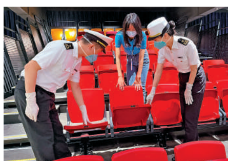
▲深圳海關對世界盃看台供應企業領先體育開展監管。

該公司負責人表示，看台座椅相對於傳統的座椅來說，符合人體工學和美學，在抗UV耐熱性抗老化方面都表現突出，充分滿足FIFA對多哈世界盃看台系統嚴格的要求。此外，在建造時間上快上幾倍，使用完能快速轉移，應用在奧運會、亞運會、世界盃等多個世界大型運動項目中，目前，客戶覆蓋90個國家和地區，海外銷售佔比超過40%。