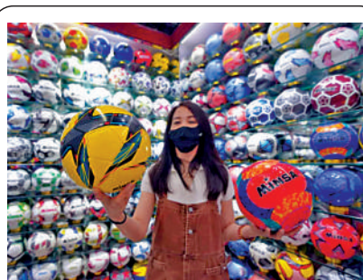
▲義烏市場上各種世界盃周邊體育用品供不應求。

中國宇通客車作為卡塔爾世界盃服務用車，承擔將政府官員、組委會、媒體、球迷運抵到運動場館的接駁任務。