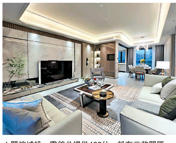
▲開控城投·雲錦共提供432伙，設有三款間隔。

屋苑除自設商場外，周邊也有多個大型商業，駕車到飛龍匯廣場、至泰廣場僅10分鐘，離萬達廣場、高德匯購物中心及優托邦也在25分鐘車程內。教育配套方面，項目小區內有9班幼兒園，鄰近北京師範大學廣州實驗學校、鐵英中小學、二中蘇元實驗學校等。