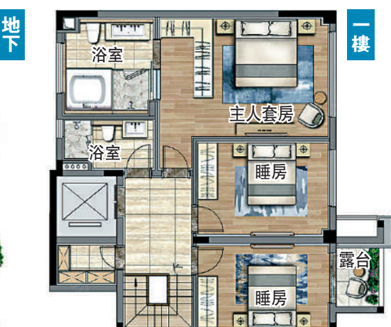
▲183平米四房兩廳戶型圖。