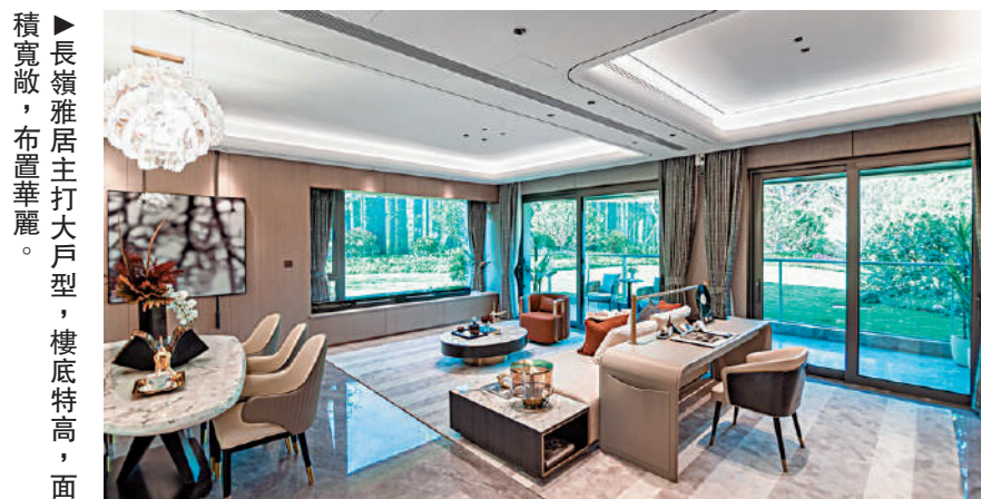
▲長嶺雅居主人大戶型，樓底特高，面積寬敞，布置華麗。