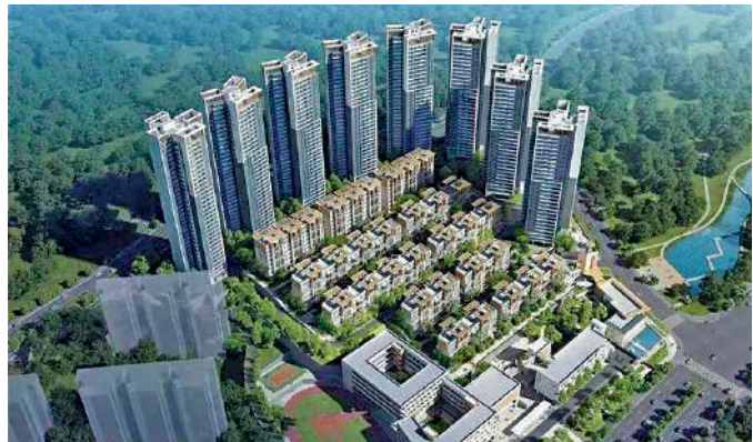
▲五礦壹雲台包括疊拼別墅及分層住宅，戶型多元化。