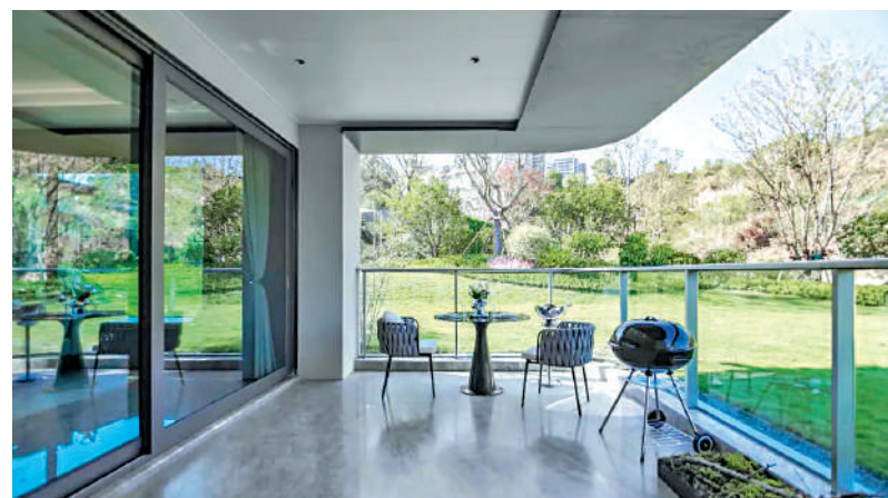
▲長嶺雅居三山環抱，住戶外望綠悠悠美景，心情倍添開朗。