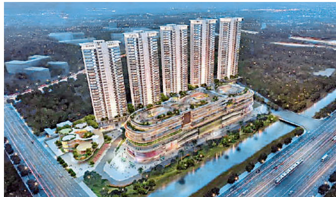
▲開控城投·雲錦由5幢住宅及一個大型商場組成。