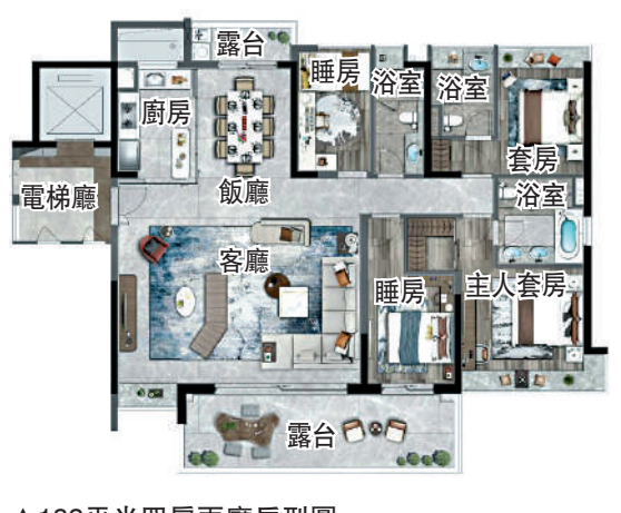
▲183平米四房兩廳戶型圖。