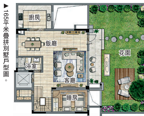
▲160平米疊拼別墅戶型圖。

其他生活配套方面，周邊有廣州醫科大學附屬婦女兒童醫院、廣州市第十一人民醫院、泰康之家粵園、蘿崗福利院等醫療配套，規劃或在建的醫療項目還有寶能國際總醫院、廣醫附屬醫院婦女兒童醫院（黃埔院區）等。整體而言，周邊的公營醫療配套進一步完善，能夠滿足業主的就醫需求。