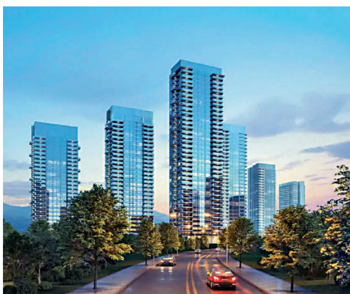
興建1080伙，一期打造12幢住宅，其中1幢為政府統籌房。

長嶺雅居由知識城集團發展，是廣州開發區最早成立的區屬國企之一，同時也是國家級雙邊合作項目——中新廣州知識城的主導者。長嶺雅居佔地10.2萬平米，建築面積38.5萬平米，規劃