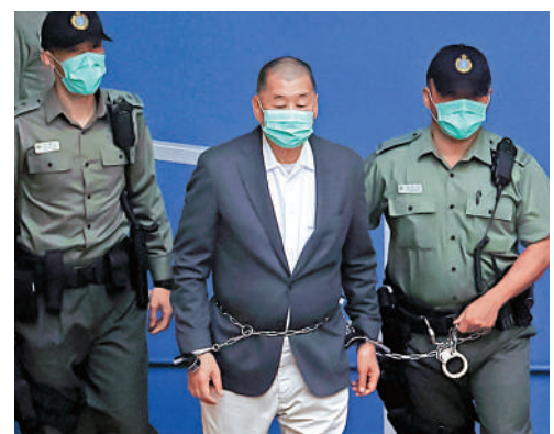
▲外國大狀黎智英辯護，很可能對國安法的實施和發展形成負面影響。

再者，正如法律界人士所擔憂的那樣，香港國安法原文以中文寫成，外國大狀如不懂中文，則唯有依賴英文譯本，但無人可以保證譯文與原文原意會否存在出入。假如理解有出入，控辯雙方則可能要在一些無謂地方浪費不必要的時間來爭拗，甚至乎若出現偏頗或不準確之處，非但無法對國安法發展形成正面影響，反而會帶來反效果。