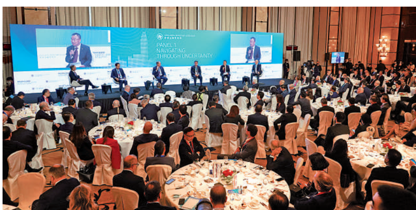
▲香港舉辦金融峰會，美國千方百計打壓。但正如其鼓吹的對華「脫鈎」圖謀一樣，都將以失敗告終。

當今世界面臨百年未有之大變局，而中國堅定奉行互利共贏的開放戰略，積極參與全球治理體系的改革和建設，對世上所有國家和地區而言，中國的新發展都將帶來新機遇。而擁有「背靠祖國、聯通世界」獨特優勢的香港，也可以抱持前所未有的底氣，實現更大更輝煌的成就。