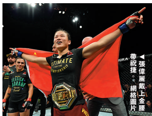
張偉麗戴上金腰帶慶祝。

出生日期： 1989年8月13日（32歲） 出生地： 河北省邯鄲市 身高： 1米63 體重： 52公斤 項目： UFC終極格鬥冠軍賽 UFC賽事簡歷 2019年8月，擊敗傑西卡·安德拉德，成為首位中國及亞洲UFC草量級世界金腰帶得主 2020年3月，戰勝喬安娜成功衛冕金腰帶 2021年4月及11月，衛冕戰負於羅斯·娜瑪尤納斯，其後二度較量仍見負 2022年6月12日，擊敗喬安娜，獲金腰帶挑戰權 2022年11月13日，擊敗卡拉·埃斯帕扎，重奪金腰帶