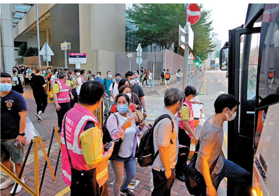
▲ 大批受影響乘客排隊改搭港鐵安排的穿梭巴士。