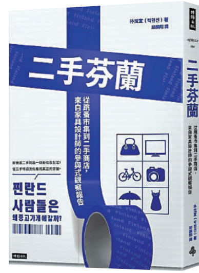
◀ 朴炫宣著、邱麟翔譯《二手芬蘭：從跳蚤市集到二手商店，來自家具設計師的參與式觀察報告》，台灣時報文化出版。

二手商店不只是實踐循環經濟的場域，「回收再利用」也象徵了未來、環境和永續性。二手物品文化將讓人重新思考及發現物品的價值，也讓人從完全不一樣的角度深度理解芬蘭。