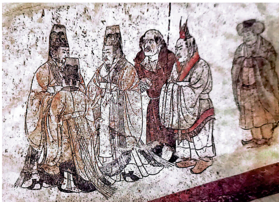
◀ 陝西乾縣乾陵唐代章懷太子墓壁畫《東客使圖》。

通過這些圖像史料，我們對文字記載的歷史會有更直觀的了解。比如，山西太原王郭北齊婁睿墓的壁畫，讓人真切地看到了「胡服」裝束的樣子。沈括曾說：「中國衣冠，自北齊以來乃全用胡服。」婁睿墓的壁畫為此提供了視覺例證。作者在書中提醒讀者注意畫中武士的馬具。「在婁睿墓的壁畫裏，馬的配具完善且精良，絡頭齊全，鞍韉具備，馬頭下的繯子，馬背上的障泥，皆襯托出駿馬的起飛英姿。」其中最值得注意的則是高橋式馬鞍的出現，這種馬鞍半圍馬身，可以把壓力從馬脊骨分散到兩側肋骨上，減輕馬的局部壓重，前後隆起的高橋則可以防止騎兵在馬背上前後滑動，為騎兵的高速作戰提供支持。婁睿墓壁畫裏的馬側皆有馬