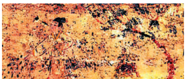
▲ 《河西走廊：亂世裏的「桃花塢」》以多幅河西出土的魏晉磚畫和壁畫為例，展示農業生產的諸多細節。