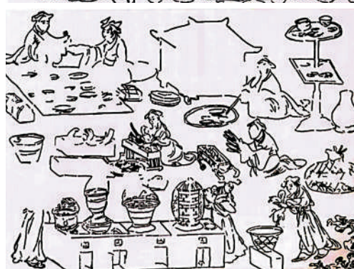
◀ 河南打虎亭漢墓壁畫展示了高官家宴的盛況。