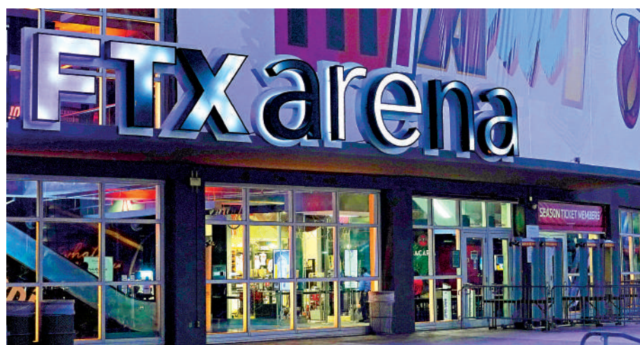
▲分析指，FTX破產恐現火燒連環船，引發加密貨幣拋售潮。