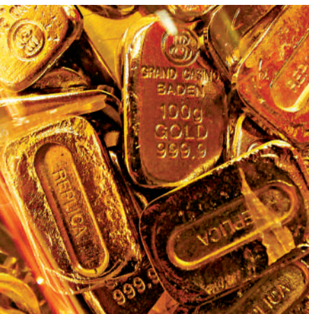
▲加密貨幣市場崩潰，令黃金表現非常搶眼。