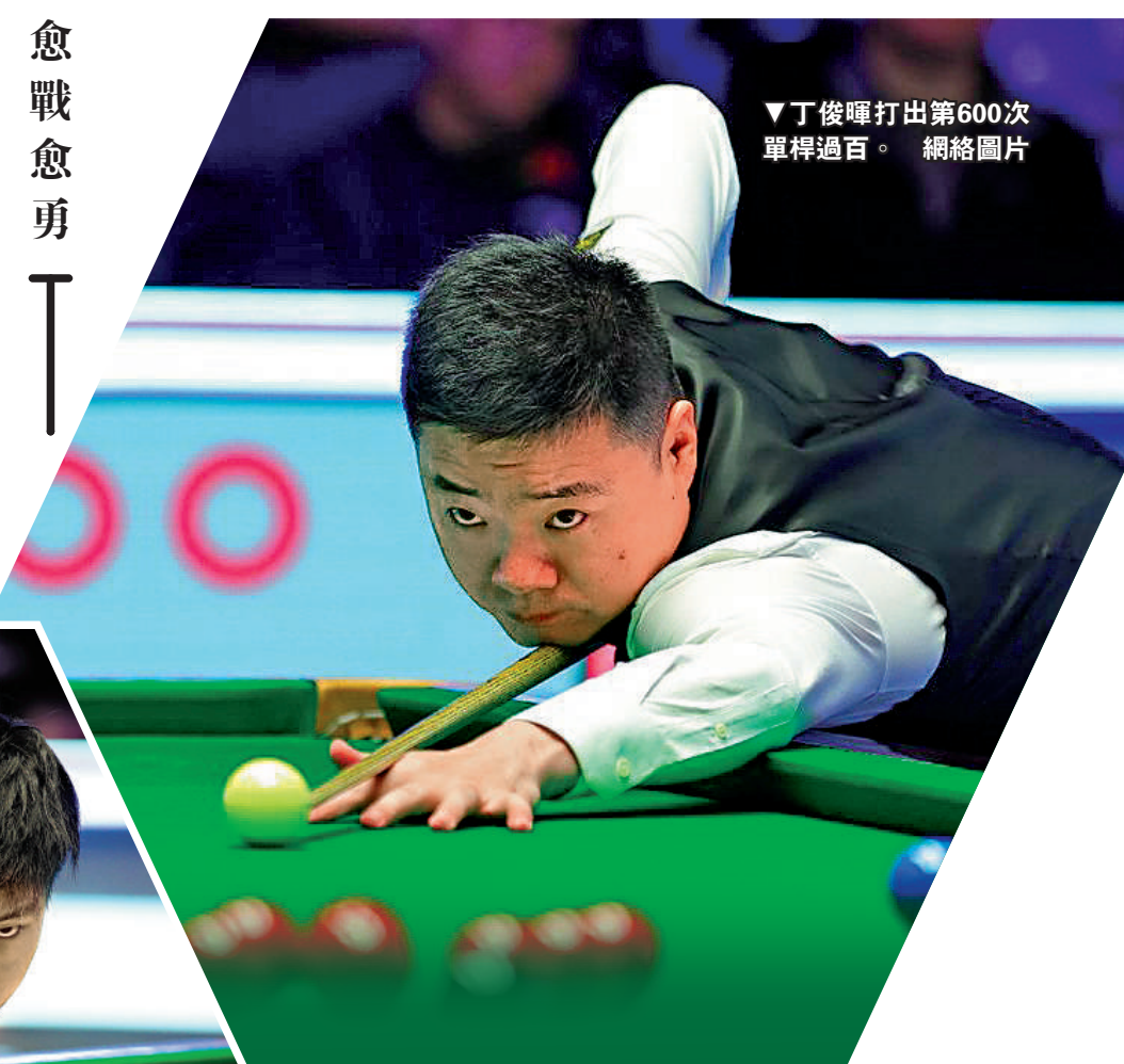
丁俊暉打出第600次單桿破百。