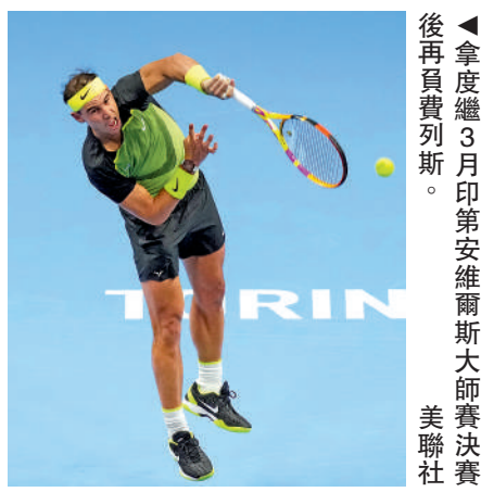
拿度繼3月印第安維爾斯大師賽決賽後再負費列斯。

魯特與阿利亞施美在綠組另一場小組賽爭奪首勝，魯特同樣完全保住自己的發球局，最終以7:6(4)、6:4擊敗阿利亞施美，賽後更取得對阿利亞施美的3連勝。