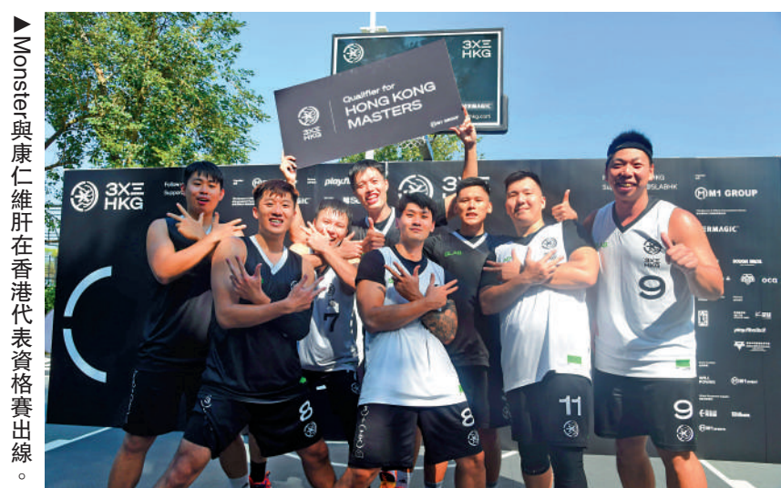
Monster與康仁維肝在香港代表資格賽出線。