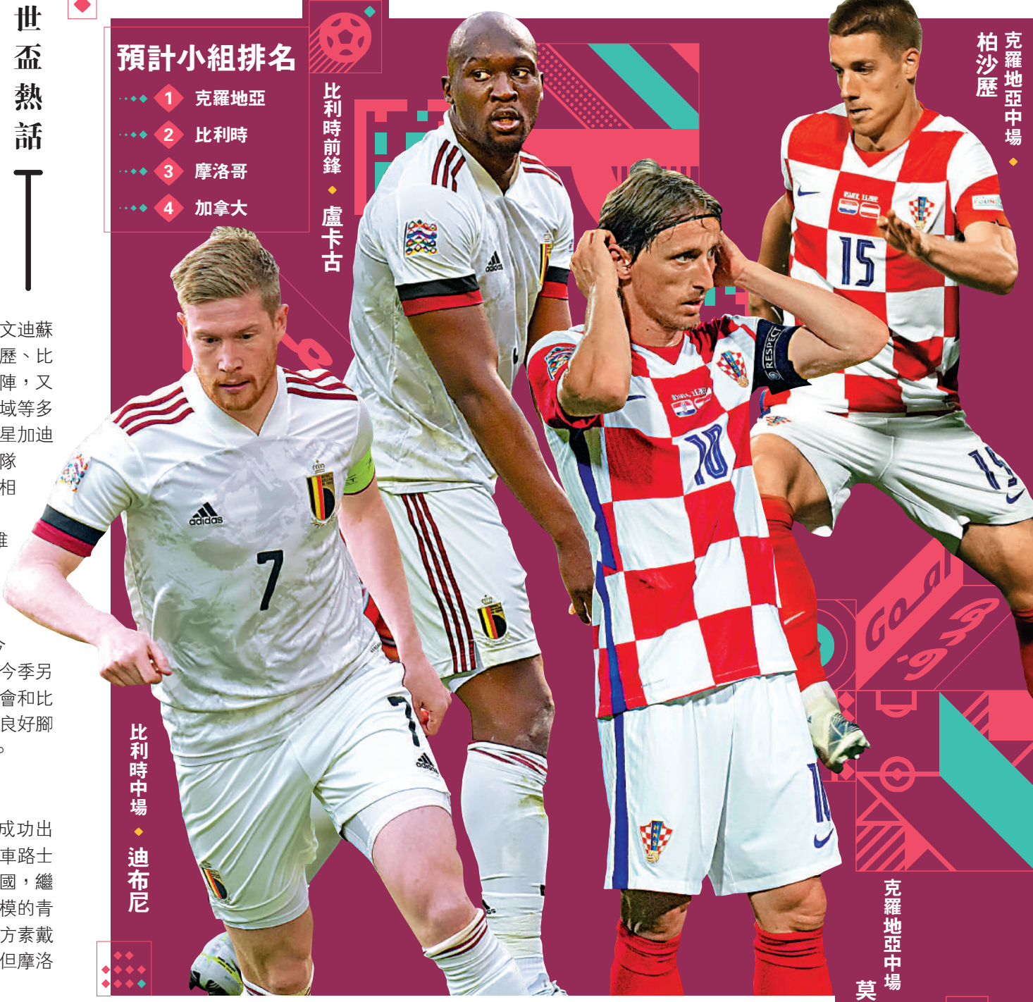
比利時前鋒 盧卡古

摩洛哥今次是第6次入圍，之前僅有1次成功出線，今次以在歐洲效力球員為主，最具名氣為車路士翼鋒薛耶治；加拿大在外圍賽壓倒墨西哥和美國，繼1986年後史上第2次入圍，10多年前開始具規模的青訓計劃略有所成，陣中亦有拜仁慕尼黑後衛艾方素戴維斯、助布魯日出線歐聯16強的達莊保查蘭，但摩洛哥仍難與克、比匹敵。