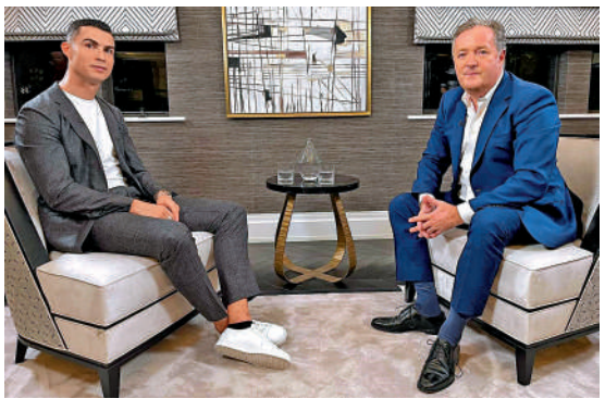
C朗拿度（左）接受英國一個電視頻道訪問。

續第2次未被納入比賽名單，提前休息準備世界盃。曼聯憑着基斯甸艾歷臣先拔頭籌，雖然「倒戈」的丹尼爾占士一度扳平，但後備的阿根廷新星加拿拿在補時3分鐘取得其英超首個入球，助曼聯險勝2:1，仍穩守聯賽榜第5位。