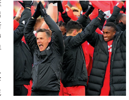
教練靴特文（左）領加拿大獲決賽周資格後慶祝。

已執教比利時6年的馬天尼斯，之前帶領史雲斯、韋根和愛華頓都能成功提升球隊水平，上屆世界盃亦助球隊取得歷來最佳的第3名，今屆當然希望更上一層樓。 上屆外圍賽臨危接手的克羅地亞教練達歷許下不成功、不留下的諾言，結果破釜沉舟領軍入圍更殺入決賽，但經歷去年歐國盃16強止步後，漸有促其辭職的聲音，今次壓力肯定很大。摩洛哥的列格古是小組唯一球員時代曾為國家隊比賽的教練，且看有否幫助。