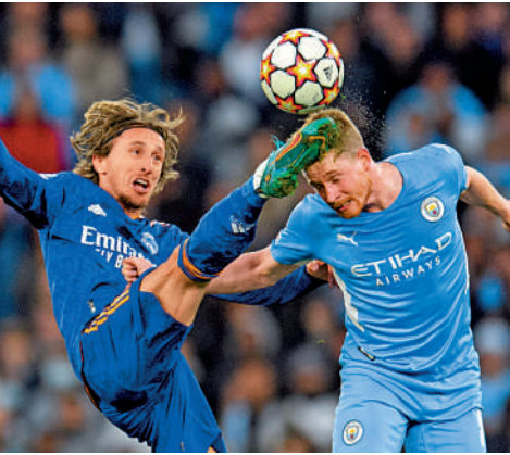
莫迪歷（左）與迪布尼曾在上屆歐聯四強交手。

焦點 得中場、得天下，克羅地亞和比利時目前已經各自得到一位頂尖級數的中場：莫迪歷與奇雲迪布尼，兩人無論在國家隊或球會都屬靈魂人物，往往在關鍵時刻作出決定性的貢獻；若劍擊比賽有所謂的「決一劍」，克、比兩隊今屆比賽隨時可能要靠莫、迪兩人「決一腳」。 效力皇家馬德里的莫迪歷，上屆帶領克羅地亞驚喜地殺入決賽，之後亦順理成章奪得金球獎和世界足球先生兩大個人最高殊榮。4年後莫迪歷雖已年屆37歲，惟水準卻未見大幅下跌，早前還助球隊出線歐洲國家聯賽決賽周，今季也繼續是皇馬主力兼有好表現，世界盃當然繼續球隊定海神針角色。 31歲的迪布尼多年來素有「助攻王」之稱，國際賽助攻紀錄迫近百，今季聯賽暫時亦已經為曼城貢獻9次助攻，冠絕英超，在歐聯分組賽只亮相4次亦3度送出助攻；當球迷往往把目光投射在入球者身上時，默默兼「密密」當間接功臣的迪布尼卻是不能或缺的建築師，對比利時的重要性，尤勝任何人。