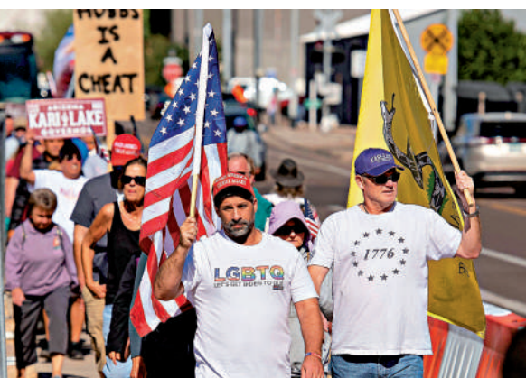
▲亞利桑那州的共和黨支持者12日抗議選舉結果。

暫時沒有退休計劃。 眾議院的控制權仍懸而未決，分析認為共和黨人可能贏得微弱多數，意味着眾議院少數黨領袖麥卡錫有望成為新任眾議院議長。佩洛西暗示，麥卡錫可能無法在黨內獲得足夠的支持當選議長。佩洛西選對2024年總統大選發表了看法，她表示，拜登應該競選連任。 前總統特朗普最快會在15日晚上九點（本港時間16日早上10點）召開記者會，宣傳參選2024年大選。根據YouGov在11月9日至11日進行的民調，42%的共和黨支持者希望佛州州長德桑蒂斯成為2024年代表共和黨出戰的總統候選人，較前總統特朗普（35%）高出7個百分點。