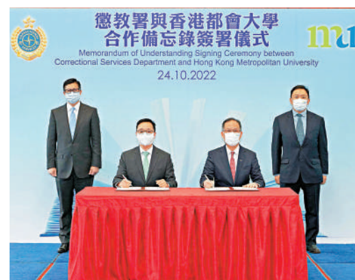
▲懲教署與都會大學上月底簽訂合作備忘錄，加強對在囚人士的學習支援。

【大公報訊】為加強支援在囚者圓大學夢，懲教署與香港都會大學（都大）十月底簽訂合作備忘錄，深化合作關係，落實雙方在教育方面的長遠合作，為希望繼續進修的在囚者提供更全面的支援。