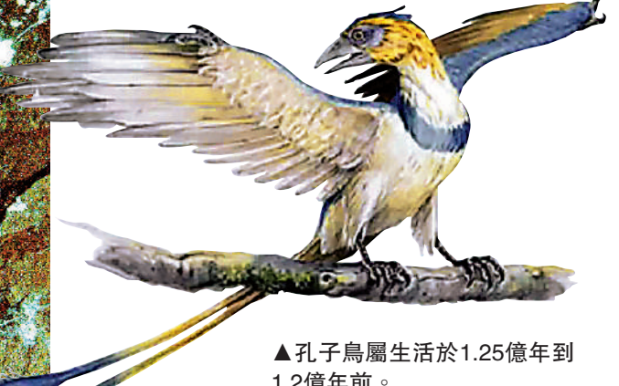
▲孔子鳥屬生活於1.25億年到1.2億年前。

恐龍為何能飛行？古生物學家從生物骨頭化石中推斷，牠們的早期飛行狀態，是利用肩部及胸部肌肉分別為上拍飛行及下拍飛行提供動力。由香港中文大學及國際古生物學家組成的研究團隊，成功利用尖端的鐳射成像技術，發現了支撐古代飛行恐龍撲翼的軟組織，進一步驗證了科學界對早期飛行狀態的假設。