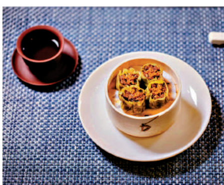
幹細胞生產人造蝦肉