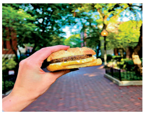
人造肉增加糧食供應