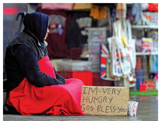
▲英國乞丐15日在倫敦牛津街街頭乞討。

新任財政大臣亨特將於17日公布最新中期預算案，《衛報》指出，最新出爐的通脹數據是「一個不受欢迎的消息」。面對550億英鎊的財政赤字，英媒普遍預測，亨特將在新預算案中提出增加稅款及縮減公共開支。稍早前，