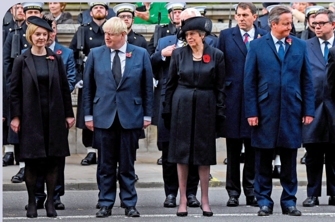
▲英國6年內換了5位首相，圖為（左起）前首相特拉斯、約翰遜、特蕾莎·梅及卡梅倫13日出席活動。

【大公報訊】綜合路透社、《衛報》、《鏡報》報道：英國政治經濟在脫歐後持續混亂，10月份通脹升至41年新高，首相府唐寧街10號則在過去幾年頻繁易主，最近四個月內更換了三任首相，讓民眾心生厭倦。英國媒體引述有社會工作者表示，他們正在更新針對痴呆症患者的測試內容，不再詢問患者「誰是英國首相」這一問題，因為他們很可能答不上來。