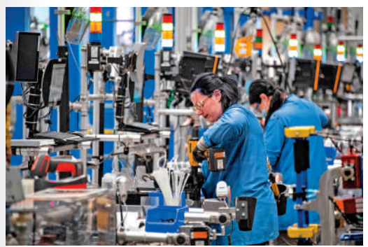
▲亞馬遜預計裁員一萬人，圖為員工10日在機器人工廠內工作。

《紐約時報》14日披露，亞馬遜計劃裁減1萬名員工，約佔員工總數的3%左右，主要涉及零售、設備和人力資源部門。一名知情人士