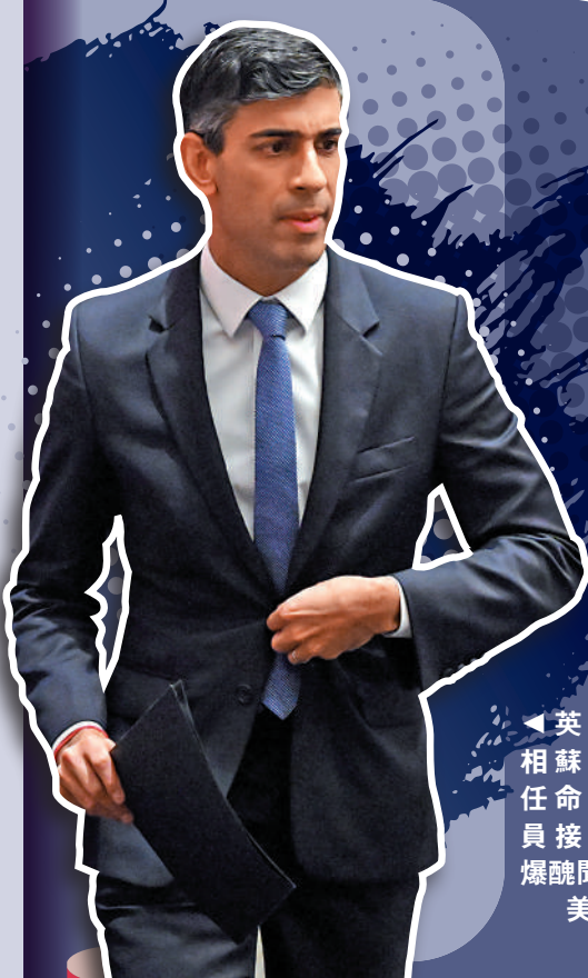
▲英國首相蘇納克任命的閣員接連被爆醜聞。