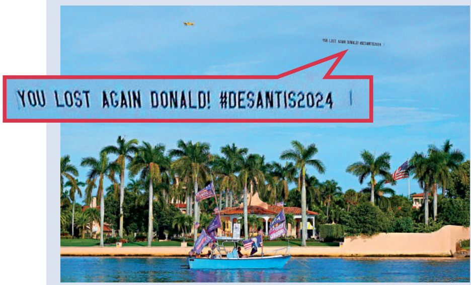
▲海湖莊園上空15日飄過「特朗普再次落敗！德桑蒂斯2024」的標語。