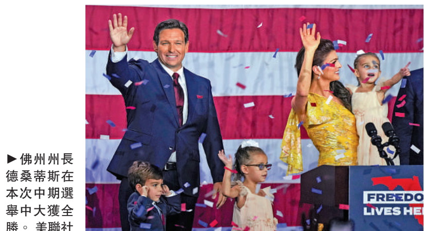
▶佛州州長德桑蒂斯在選戰中大獲全勝。