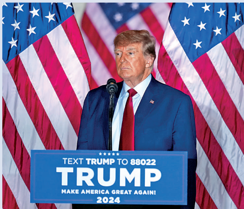
▶美國前總統特朗普15日在海湖莊園宣布參加2024年總統大選。