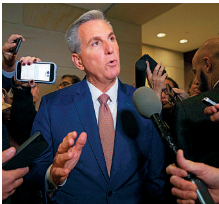
▲美國眾議院共和黨領袖麥卡錫15日成功連任。美聯社

【大公報訊】綜合CNN、美聯社報導：當地時間15日舉行的閉門會議上，美國眾議院共和黨領袖麥卡錫，獲得188票支持，擊敗獲得31票的右翼眾議員比格斯，繼續當選眾議院共和黨領袖。投票結果表明，要在明年眾議院全體成員投票中獲得至少218票支持，麥卡錫才能擔任眾議院議長一職。