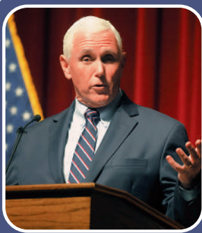
佛州州長 德桑蒂斯

美聯社對全美近10萬名選民的民調顯示，在中期選舉後，54%的選民對特朗普的評價「非常差或比較差」。共和黨民調專家艾爾斯表示，約50%共和黨的選民「之前可能是特朗普的支持者」，但本次中期選舉後，他們可能轉而支持其他人。