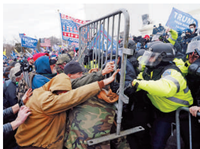
◀去年1月6日，特朗普的支持者衝擊國會大廈。資料圖片

眾議院「106調查委員會」上月向特朗普發出傳票，要求其提供與去年國會暴亂有關的證詞。特朗普拒絕傳喚，或面臨刑事指控。