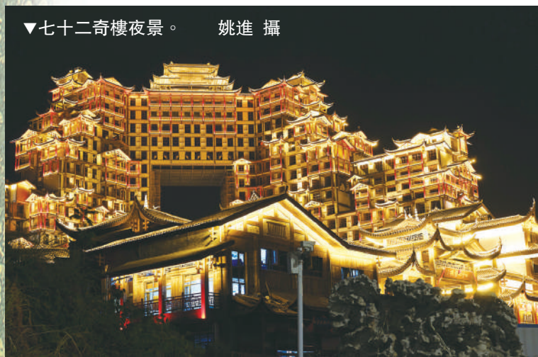
▼七十二奇樓夜景。

作為湖南省的旅遊龍頭，張家界必然要為湖南省旅遊產業升級戰打響第一槍。通過「立標打樣」，達到「一地舉辦、全省聯動；一花引領、百景爭艷」的效果。