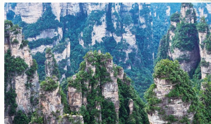
▲武陵源風光。 姚進 攝