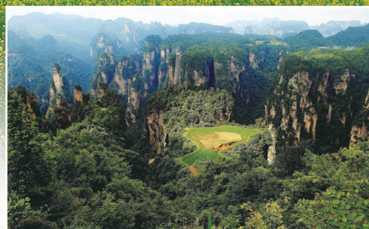
▲空中田園。