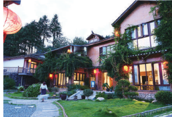
▲武陵源水木瀟湘民宿。