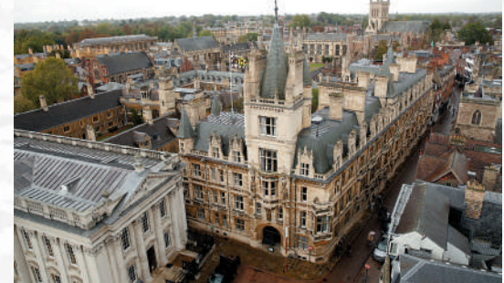
▲劍橋大學考古學的科目種類廣泛，很多冷門科目供同學選擇。

本港學生若想報考該校，一般錄取要求為四個核心科目的成績均為5分，兩個或更多科目成績為5*分。對於數學和進階數學均有要求的劍橋課程，申請人必須以數學科延伸部分單元二作為其選修科。而想以B成績報讀劍橋的同學，則需要達38至40分或以上。至於英文要求方面，學生要有IELTS試7.5分總分的成績。