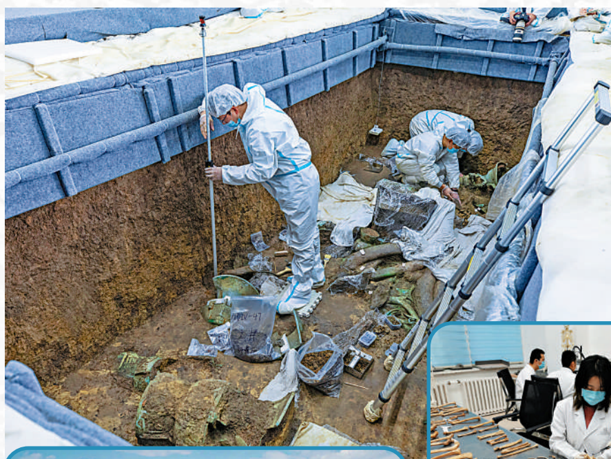
埋在地下歷史遺跡，就是一本活史書，等待考古學家去發掘真相。圖為考古人員在三里堆遺址進行考古工作。