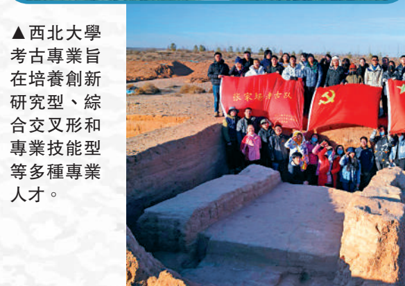
▲西北大學考古專業旨在培養創新研究型、綜合交叉形和專業技能型等多種專業人才。