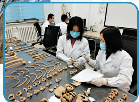
▲吉林大學的生物考古實驗室去年入選首批教育部哲學社會科學實驗室試點建設單位。