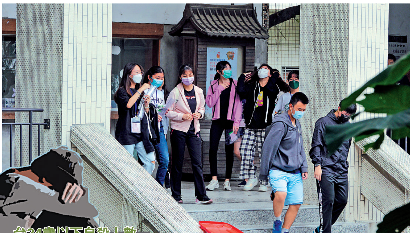
▲這些年台灣青少年自殺率年年攀升，引起台灣社會高度關注。資料圖片

李正圻表示，民進黨執政6年多來，「缺、亂、差」已成施政代表字，治安惡化、物價高漲、生活壓力不斷上升，兩岸關係也充滿不確定性。這些都使台灣青少年生活在一個壓力大、希望少、未來充滿未知的年代，從側面反映出民進黨當局施政失敗。