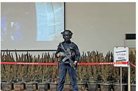
▲桃園警方17日舉辦破案記者會，展示查扣的大麻成株等證物。