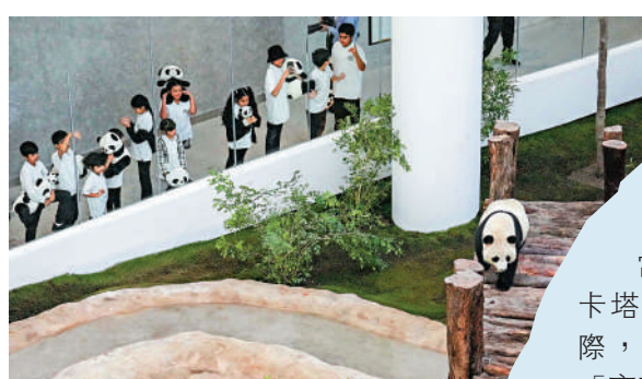
▲11月17日，當日，來自中國的大熊貓「京京」和「四海」在卡塔爾豪爾熊貓館正式與公眾見面。

內卡▶11月17日，大熊貓「四海」在卡塔爾首都多哈的豪爾熊貓館正式亮相。當地的多哈豪爾熊貓館也於當日開館。