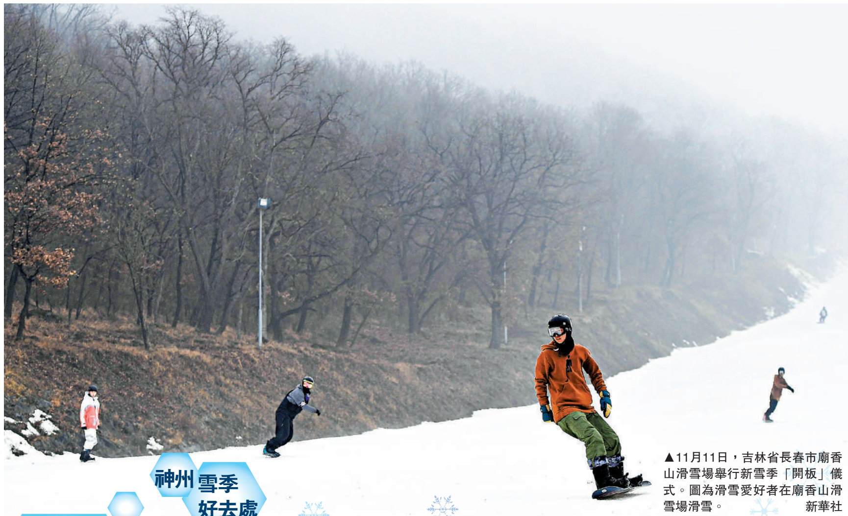
▲11月11日，吉林省長春市廟香山滑雪場舉行新雪季「開板」儀式。圖為滑雪愛好者在廟香山滑雪場滑雪。

隨着冰雪運動參與人數的持續擴大，冰雪行業發展迎來了前所未有的機遇。據內地媒體報道，11月以來，長白山、探路者、中體產業等涉及冰雪運動產業的上市公司市場表現亮眼。其中長白山自11月1日至11月16日收盤已累計上漲39.48%。