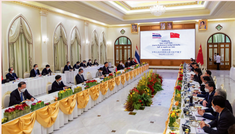
▲19日中午，習近平同泰國總理巴育舉行會談，共商中老泰聯通發展構想。