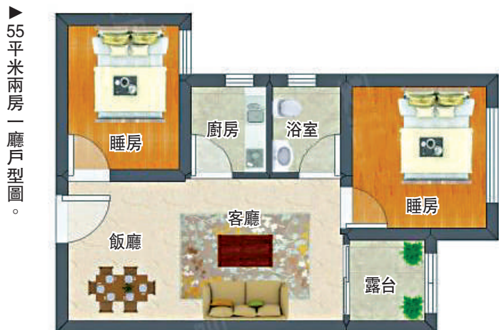
▲55平米兩房一廳戶型圖。