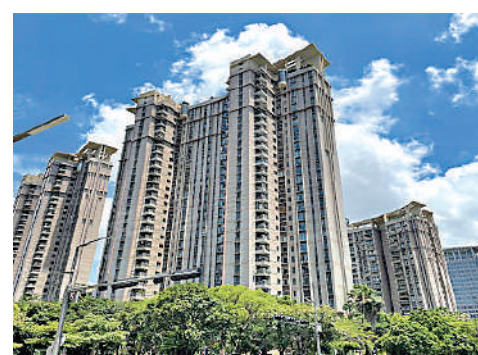
▲雅頌居於2004年落成，共提供576伙，主打大單位。