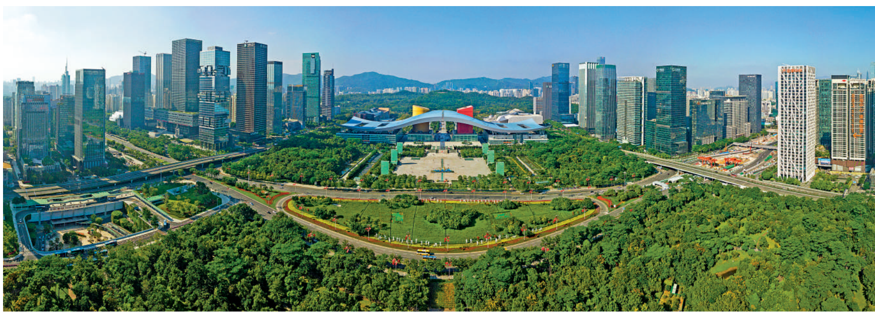
▲深圳福田區市民中心一帶，有大型城市公園，周邊甲級寫字樓林立，住宅佔地利優勢，受買家追捧。

位於福田區的「市民中心片區」，為深圳行政中心，也是深圳的金融中心和公共服務配套核心帶，大型商廈林立，市政設施優質，生活配套齊全，交通網絡發達，有不少高收入群體在區內上班，不論是單身白領還是有孩子的家庭，均希望在區內找到合適的居所，方便返工上學。市民中心片區有不少樓盤，既有單幢住宅，也有大型屋苑，二手放盤每平米售價介乎7萬至12萬元（人民幣，下同），受中產及金融界人士追捧。