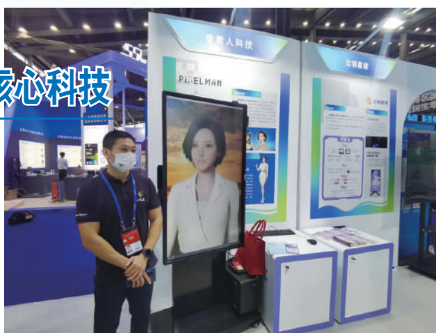
▲南山展館現場，像素人科技有限公司帶來一款AI超寫實數字人產品。

南山科技展區以「創新潮起 湧動南山」為主題亮相，圍繞深圳市「20大戰略性新興產業集群+8大未來產業」戰略部署，設置七大戰略性新興產業、領航團隊、創賽項目等科技企業進行專題展示，吸引120家南山本土高科技研發企業參加。