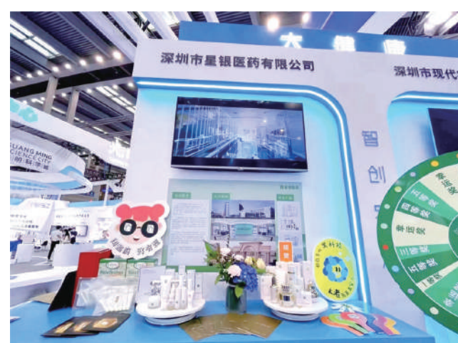
▲羅湖展館現場，星銀醫藥作為國家高新技術企業攜帶多肽創新產品亮相。

星銀醫藥作為國家高新技術企業攜帶多肽創新產品——懿庭高端美容護膚品亮相。據悉，其目前已建設了技術前沿的多肽研發實驗室和大規模的多肽原料藥生產基地，多條符合美國、歐盟FDA標準的多肽原料藥生產線，在多肽研發領域已獲得專利百餘項。