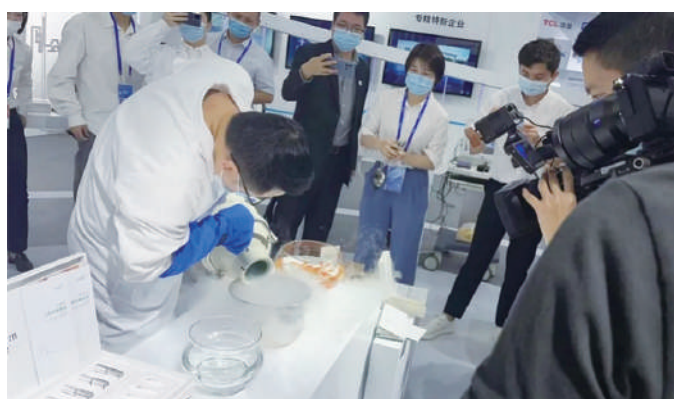
▲光明展區企業展示把金魚放進-196℃的液氮中凍僵後，再讓金魚神奇復活。

光明區以「科學之城 創享光明」為主題，以「走進光明」「科學之城」「奮鬥光明」「揚帆光明」四大版塊，全面展示光明區打造世界一流科學城的階段性成效。