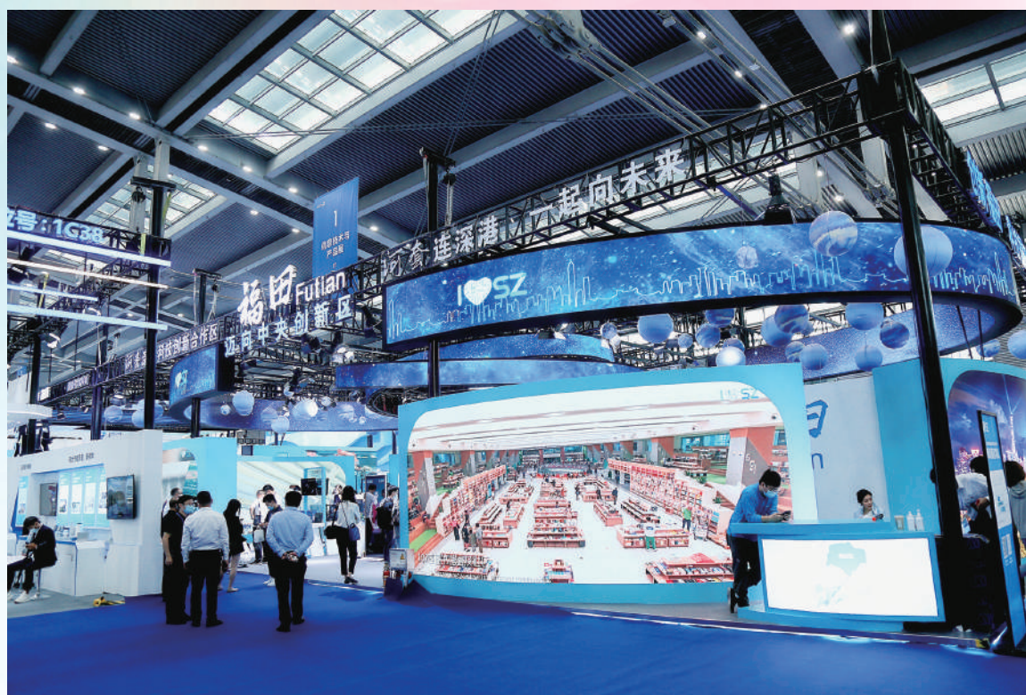
▲福田展館聚焦展示智能芯、智慧藥、智能終端等福田重點產業以及深港合作領域的核心尖端技術成果。

深圳市尚維高科有限公司生產的手持式核酸檢測儀具有便攜式、小型化的特點，適合口岸、機場等現場檢測以及居家自檢的應用場景。PCR反應時間短，可實現半小時內樣品進、結果出的檢測方案。