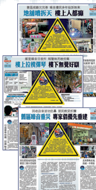
▲《大公報》連續報道香港噪音污染嚴重，多區居民飽受滋擾。